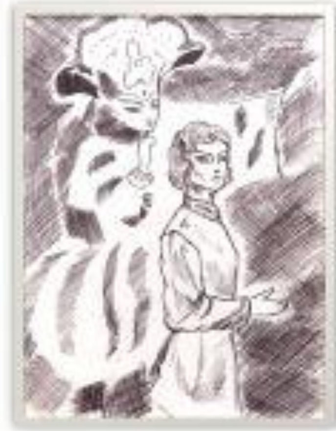
П.П.Бажов « Синюшкин колодец»

Большое количество диалектизмов встречается потому, что в основе всех сказов Бажова лежит уральский диалект, образовавшийся на территории Среднего и Южного Урала во время освоения уральских рудников (Гумешевского, Зюзельского, Красногорского, Крылатовского) и построения многих заводов на Урале – Полевского завода, Нязепетровского, Северского, группы Сысертских заводов.