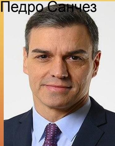
Премьер- министр Педро Санчес