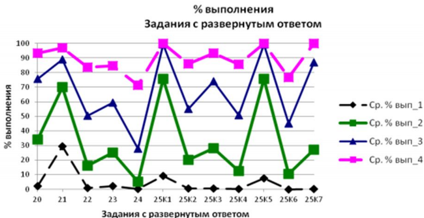
Рис. 2. Выполнение заданий с развернутым ответом участниками ЕГЭ 2019 г. с различным уровнем исторической подготовки