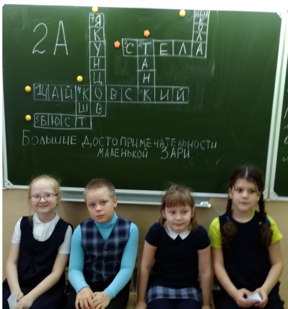
Рекордсмены-кроссвордисты 2 «А» класса