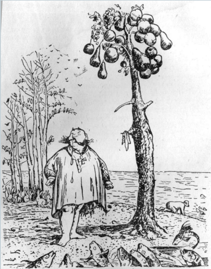
С рисунка Киквидинова.

При изучении «Повести о том, как один мужик двух генералов прокормил» М.Е. Салтыкова-Щедрина, анализируем не только аллегорию, гротеск и сатиру, но и представления генералов о еде, о культуре питания в целом.