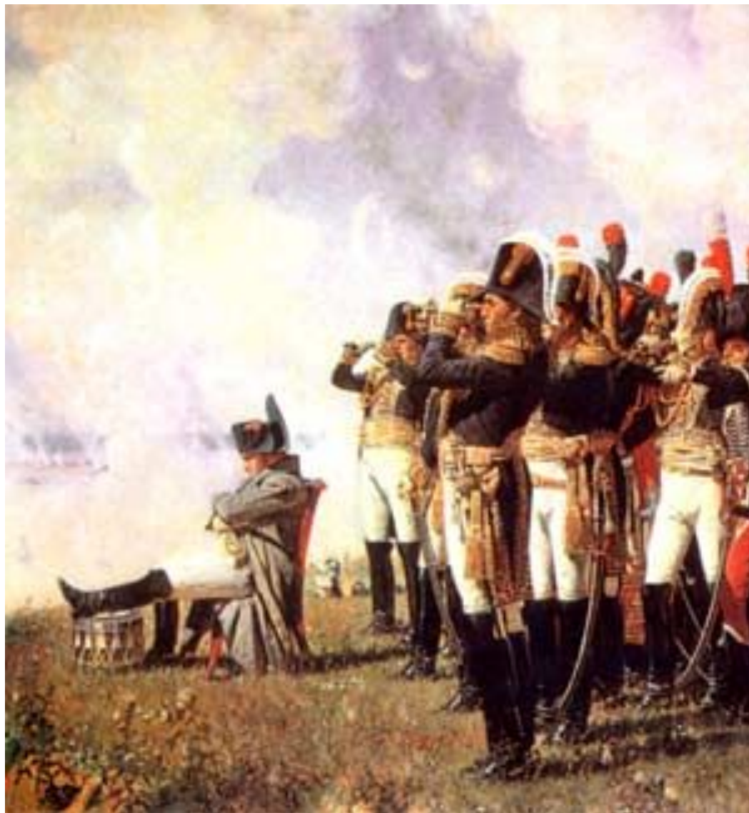
Наполеон и его армия