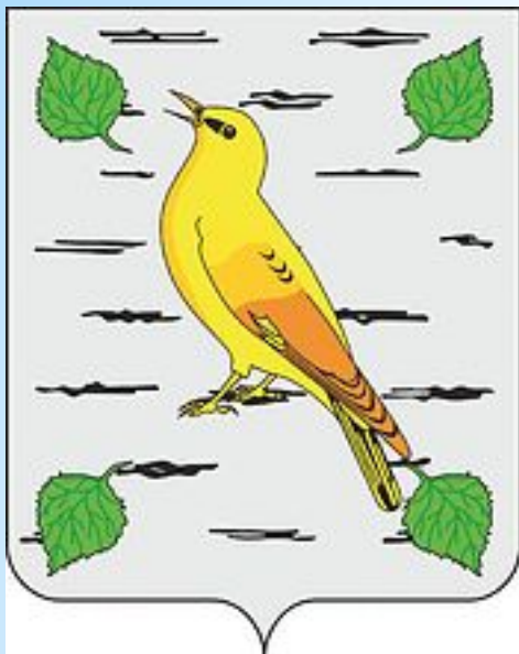
Герб Лопатинского района