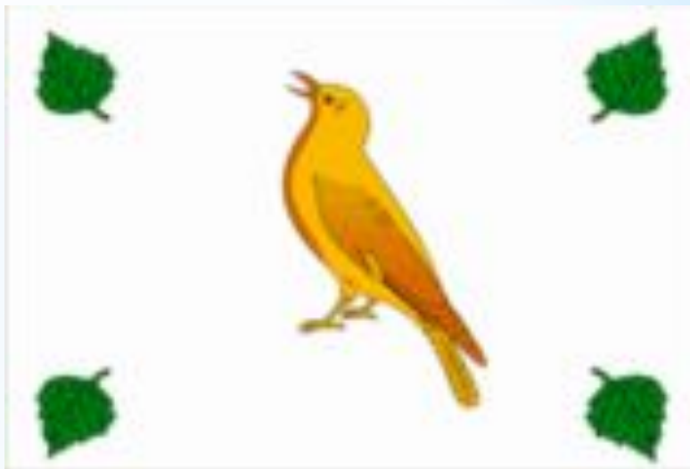
Флаг Лопатинского района