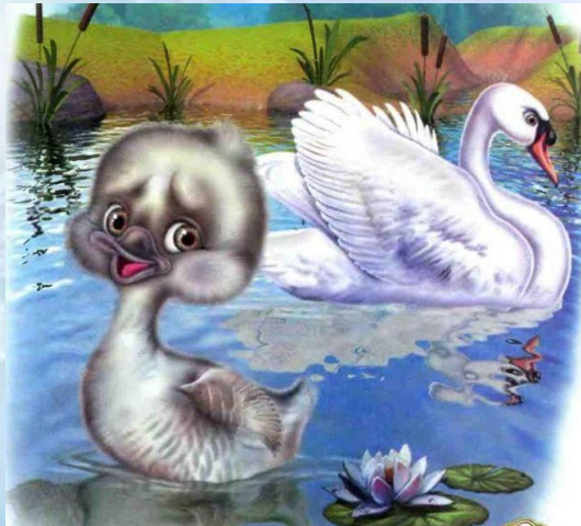
Сказка «Гадкий утенок»