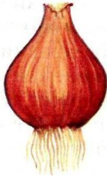
Внешний вид луковицы