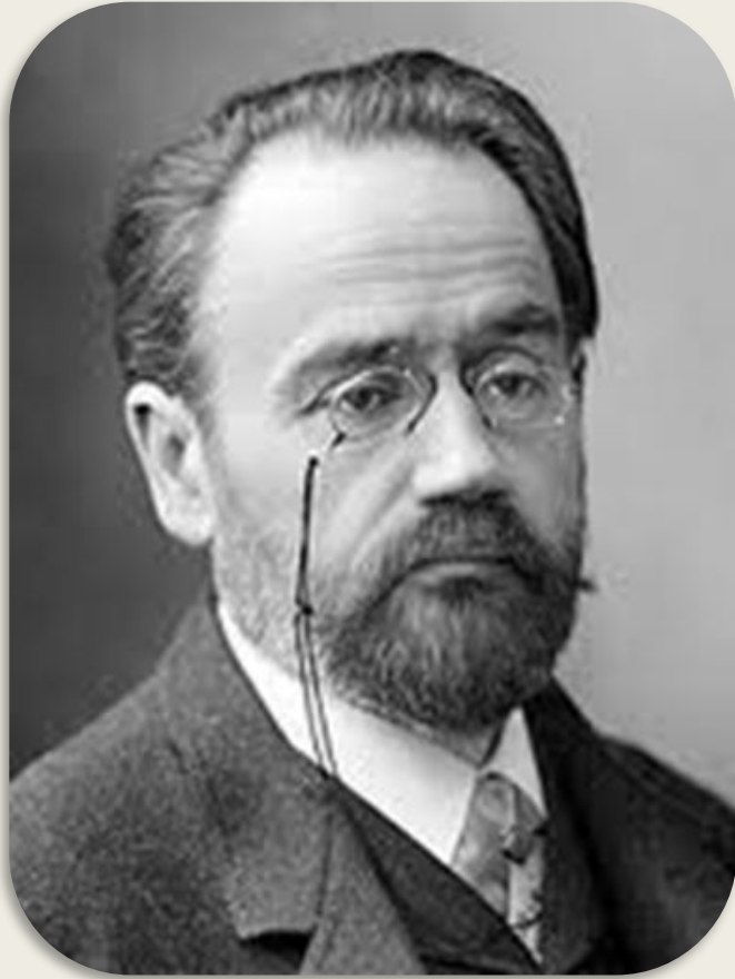
Эмиль Золя (1840-1902)