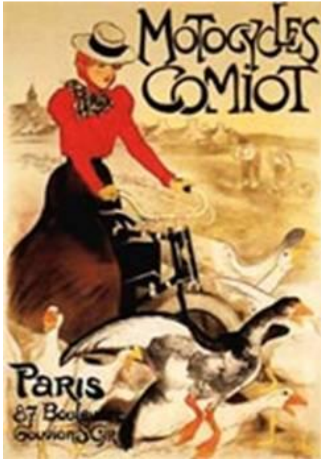
Реклама мотоциклов велосипедной фабрики «Комио»

Французский график и декоратор сцены Ж. Шере считается «отцом» рекламного плаката. Он создал больше тысячи плакатов, в основном это реклама маскарадов, выставок.