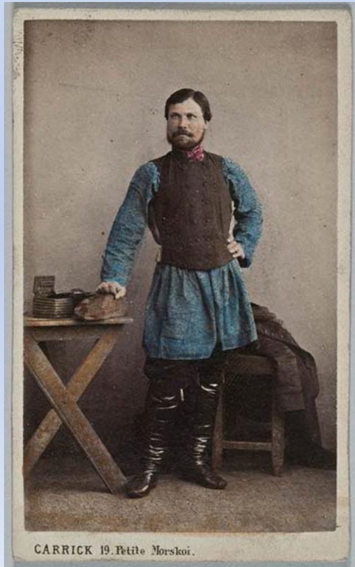
CARRICK 19. Petite Morskoï.