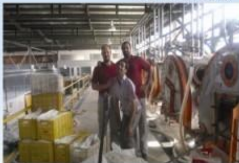
出口到伊朗设备生产现场