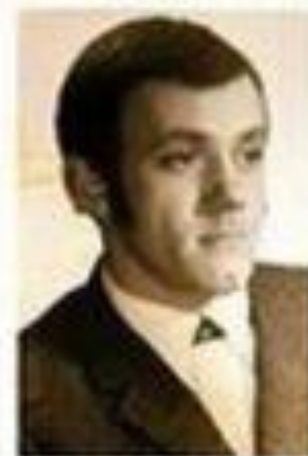
Кинопробы к к/ф «Бриллиантовая рука»