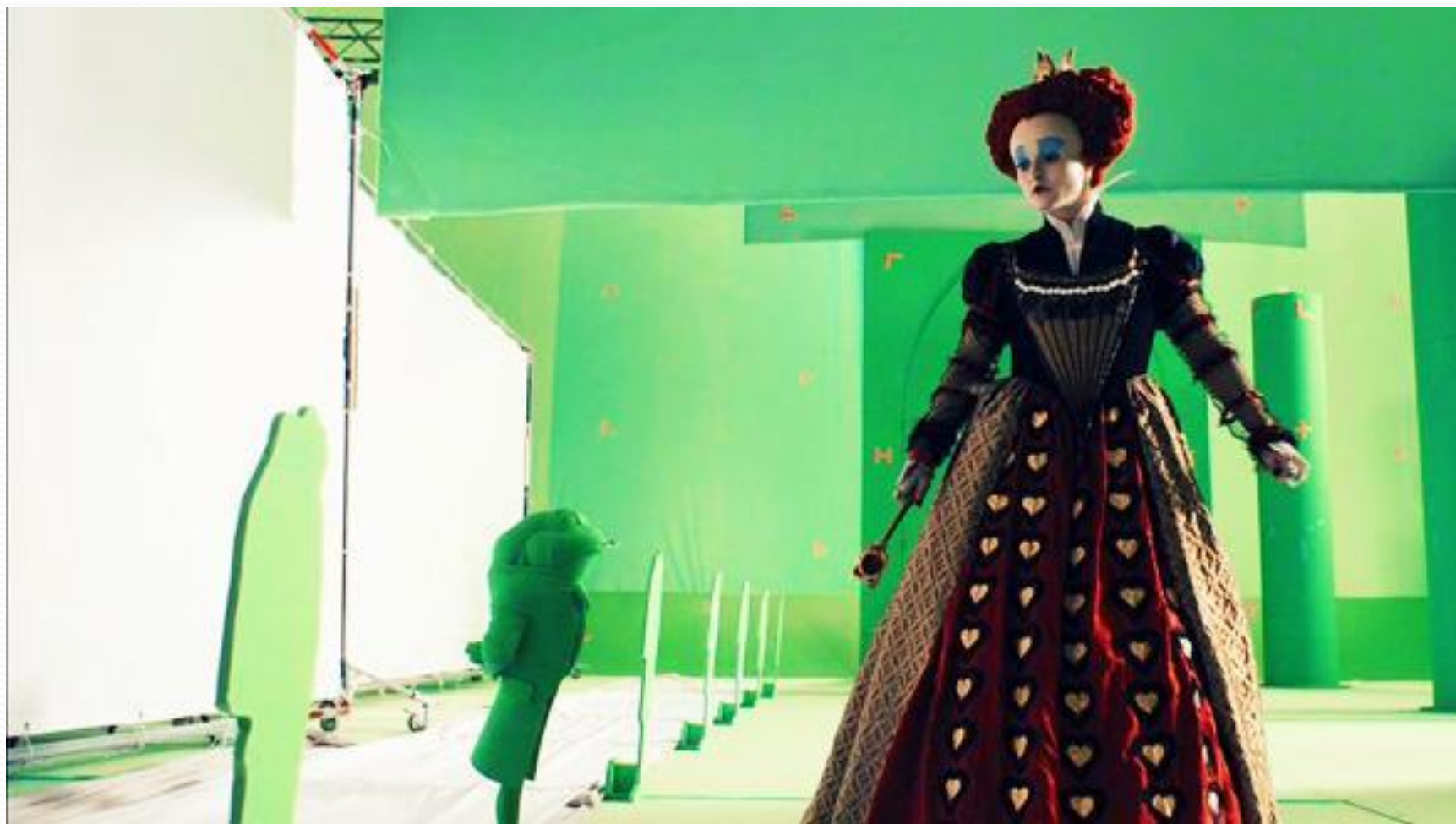
Съёмки к/ф «Алиса в зазеркалье»