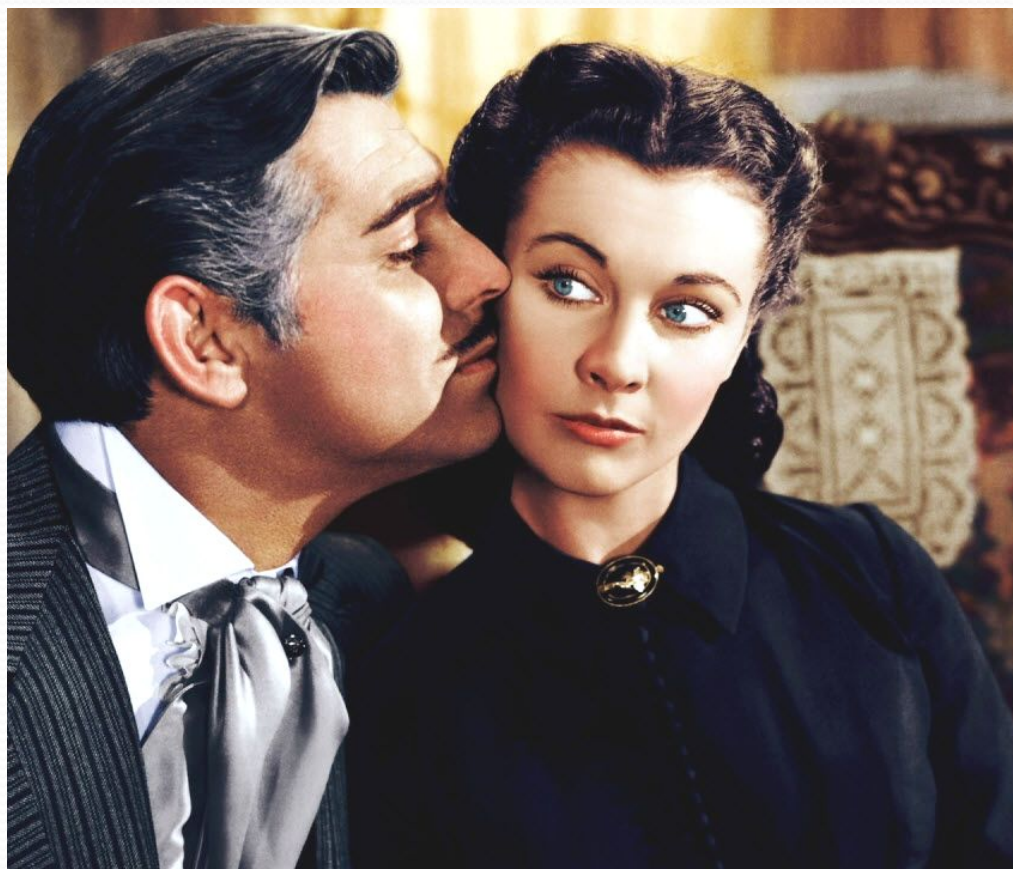
Кадр из фильма «Унесенные ветром»

Поэтому многие считают, что этот фильм в немалой степени обязан продюсеру Дэвиду Селэнику – главному распорядителю и покровителю проекта.