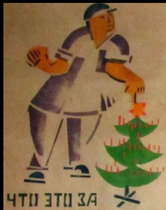
ЧТО ЭТО ЗА ПРАЗНИК ЕЛКА