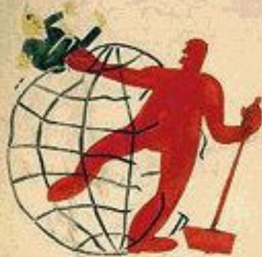
2. ЧИКАГО ПОДБИТО ПИИ