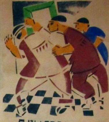
А ВЫ ГЛЯДИТЕ