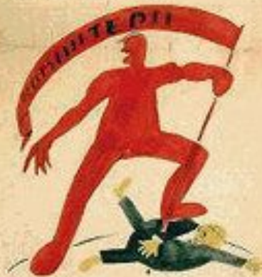
4. В. СЕРГЕЕВ И В. СЕРГЕЕВ ИЛИ