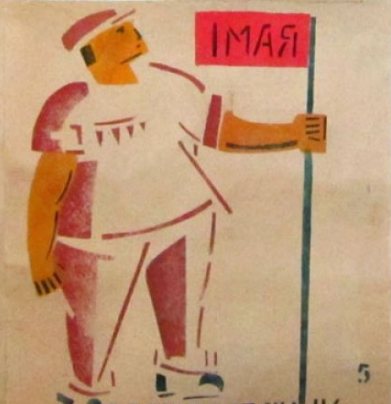
ЕСЛИ ПРАЗДНИК- ТАК ДЛЯ ВСЕГО НАРОДА