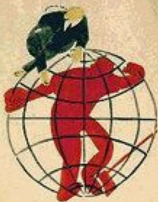
1. НИК. СТРАНИ ИЛИ ГОРИ.