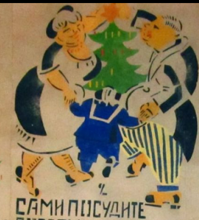
САМИ ПОСУДИТЕ БОГАТЫИ ПРАЗНОВАЮТ