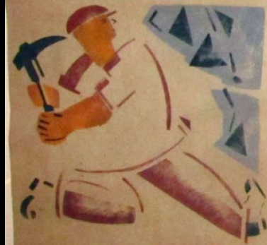
А НАШИ ПРАЗДНИКИ БУТ ЭТОГО РОДА