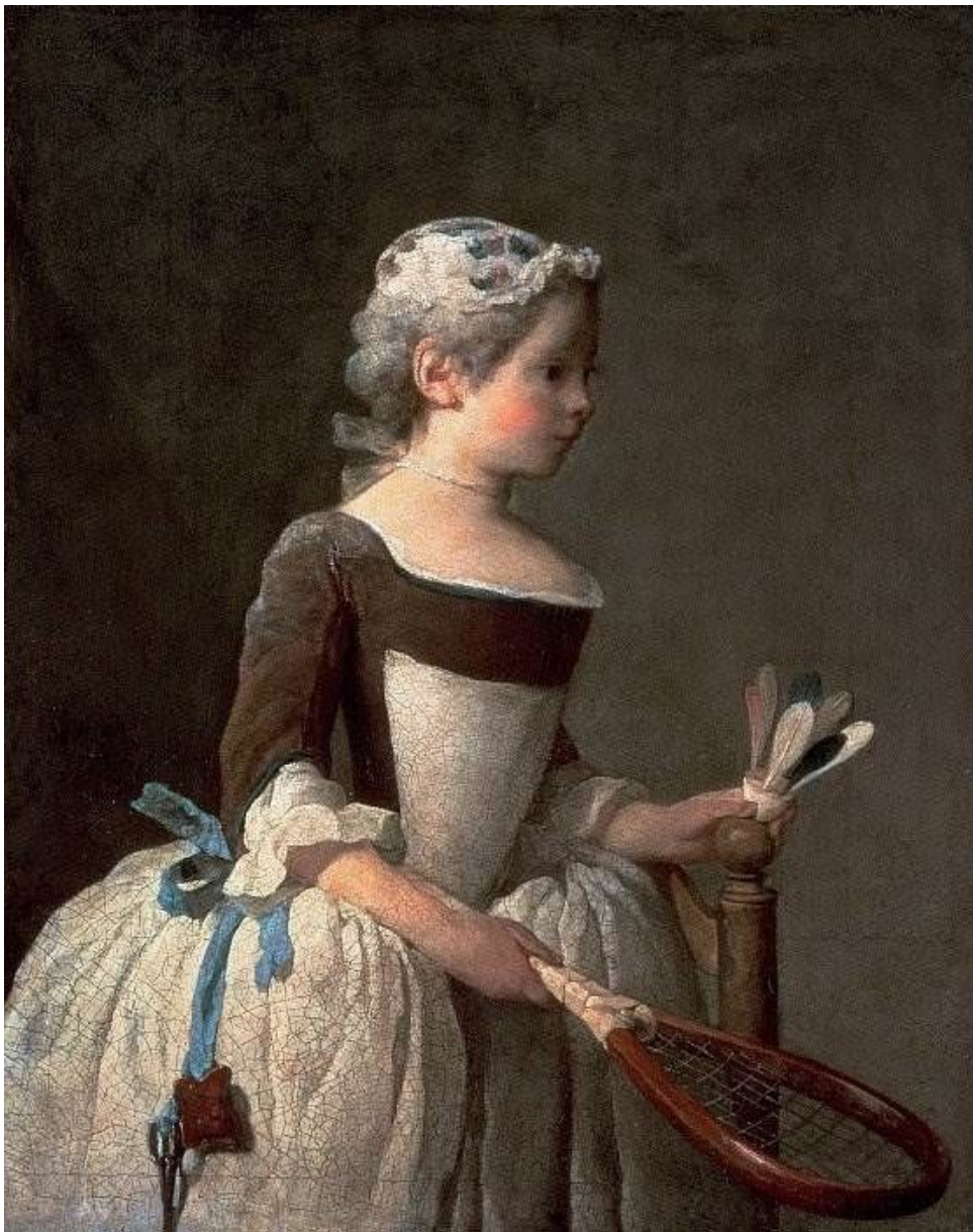
Девушка с ракеткой и вотаном