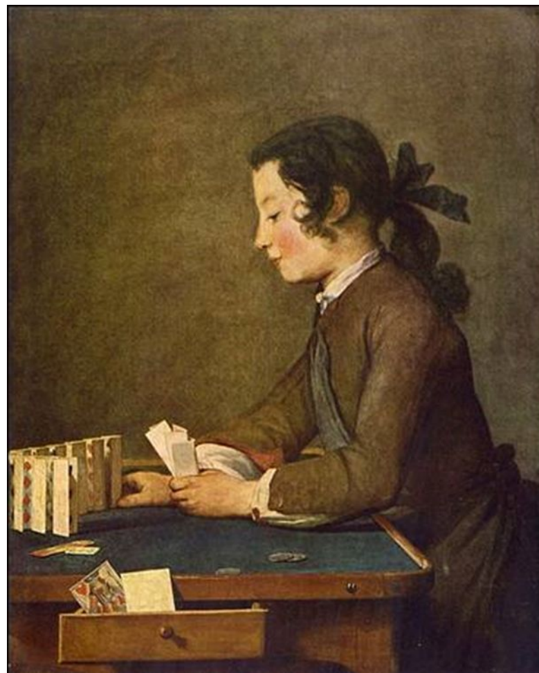
Карточный домик. Около 1735

- запечатлел в своих работах один из важнейших и наиболее нравственных идеалов — стремление к свободному труду, семейному счастью и достойному материальному положению, достигнутому столь же достойным и праведным путем. Гармония человека со своим окружением, будь то другие люди, мебель, посуда или еда — вот то, что вдохновило мастера на высокое искусство. Он утверждал право простого человека на чувство собственного достоинства, ценил стремление людей труда к трезвому размеренному порядку и уюту.