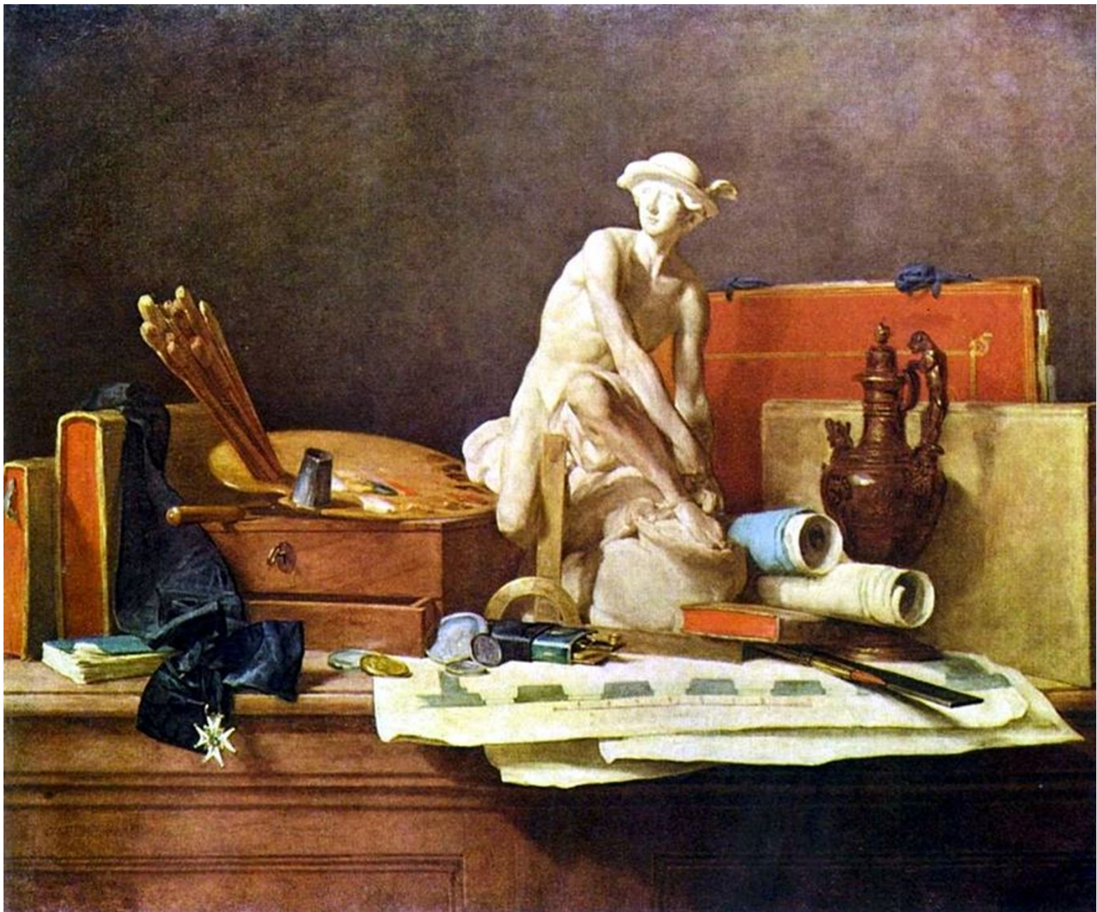
Натюрморт с атрибутами искусств. 1766