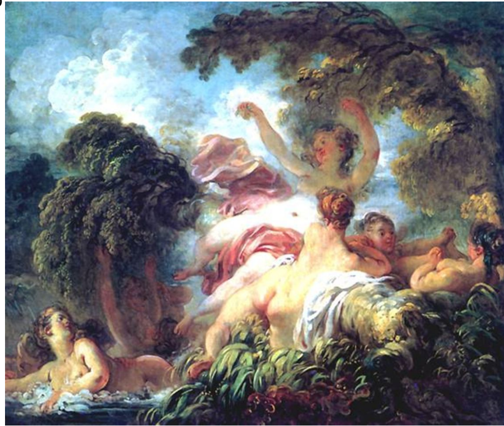
Фрагонар Купальщицы Ок. 1762

Вместе с семьей Фрагонара с 1775 года жила Маргарита Жерар, младшая сестра Марии Анны, ставшая ученицей Фрагонара и работавшая вместе с ним в последние годы его жизни. В период с 1765 по 1770 год Фрагонар создал цикл композиций, олицетворявших различные виды искусства, или, скорее, - творческие состояния. Это четыре картины, которые некогда находились в коллекции Лаказ, а в 1869 году поступили в Лувр: «Вдохновение», «Музыка» ( подписана и датирована 1769 г.; на обороте имеется старая надпись : «Портрет де ла Бретеша, написан Фрагонаром в 1769, за один час» ), «Вымышленная фигура ( также имеет старую надпись : «Портрет аббата Сен - Нона, написанный Фрагонаром за один час» ) и «Пение» ( представленное в этом посте ). Вполне возможно, что эта серия исполнялась в качестве декоративного цикла десюдепортов. В этой серии Фрагонар пишет законченные картины с непосредственностью эскизов, раздвигает традиционные рамки, предпочитая работать не с натуры, а по воображению. Кошен в письме к Мариньи от 26 октября 1767 года сообщает, что Фрагонар изучал рубенсовский цикл аллегорических композиций, посвящённых истории Марии Медичи. И в этом портрете это наглядно видно - высокий кружевной воротник напоминает о costume Марии Медичи в полотнах Рубенса для Люксембургского дворца в Париже.