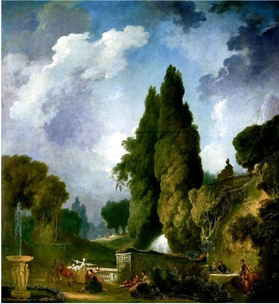
Жан Оноре Фрагонар. Игра в жмурки. 1773-1776