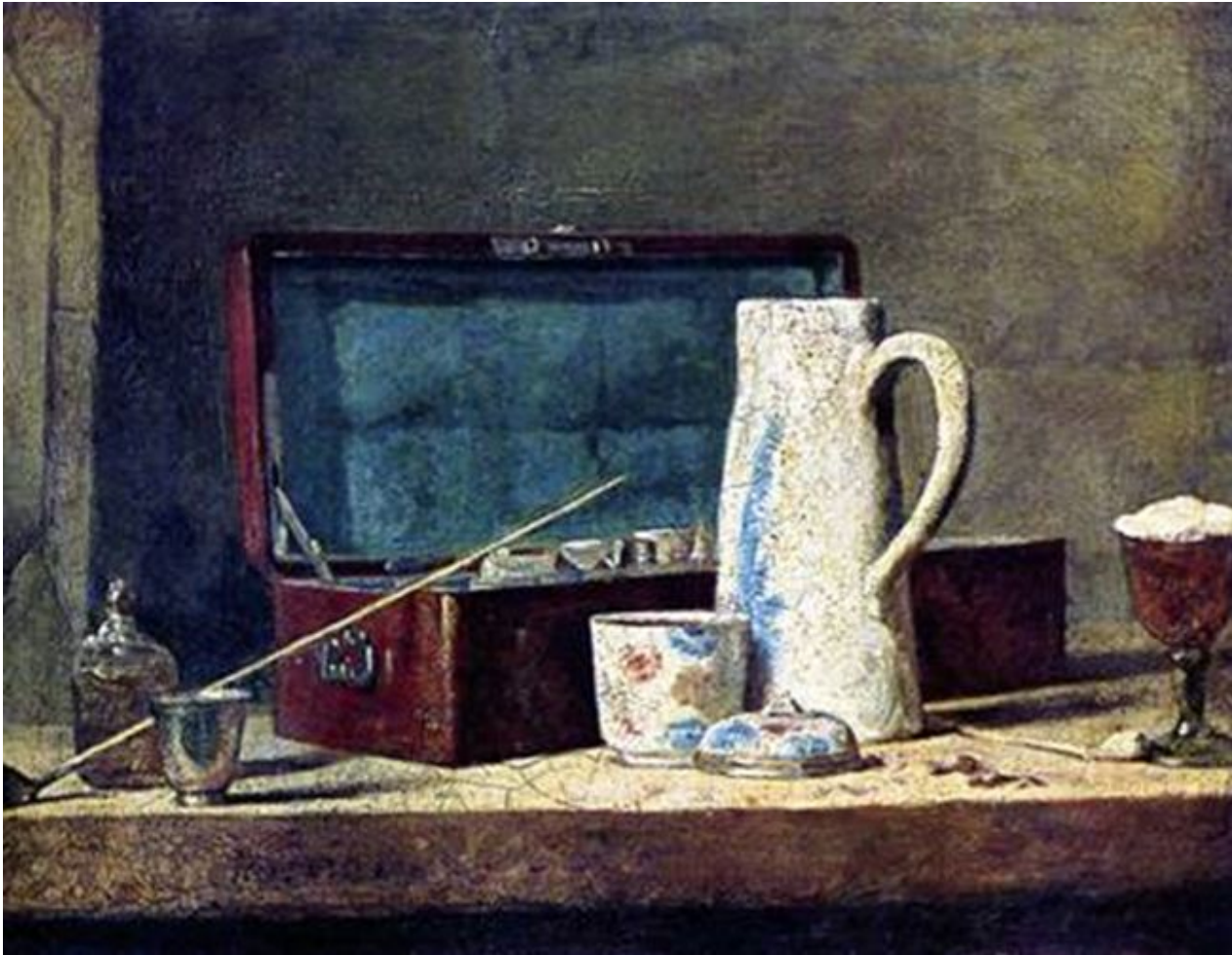
The Silver Tureen 1728