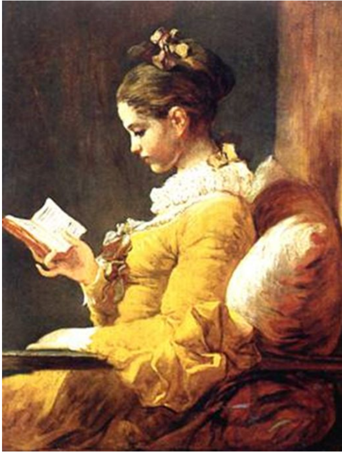
Читающая девушка Ок. 1776

Его поразили Микеланджело и Рафаэль ( он сам говорил это ), но ещё больше он взял от итальянцев XVIII века, особенно Тьеполо. Экспрессия и декоративный размах тьеполовской манеры произвели на него сильное впечатление. Возвратившись в Париж ( 1761 ), Фрагонар вскоре взялся за большую картину на звание причисленного к Академии - «Жрец Корея, жертвующий собой, чтобы спасти Каллирою» (Лувр). Он закончил ее зимой 1764 года, в 1765 году представил в Академию и показал в Салоне. Это был первый успех художника. Через год он получил заказ написать плафон для луврской галереи Аполлона, что обещало звание академика. Но Фрагонар так никогда и не написал этого плафона. Он отвернулся от исторического жанра, а после 1769 года и вовсе перестал выставляться в луврских Салонах. Официальной карьере художник предпочёл самостоятельный путь - работу для частных коллекционеров. Началом этого можно считать полученный в 1766 году от финансиста Сен - Жюльена заказ на прославившие Фрагонара «Качели». В 1769 году Фрагонар женился на Марии Анне Жерар, которая, также как и он, была родом из Грасса. В этом же году ему была предоставлена мастерская в Лувре, которую посещали многие известные люди. У них было двое детей - дочь Розали, скончавшаяся в октябре 1788 года в возрасте девятнадцати лет, и младший сын Александр Эварист, ставший впоследствии художником и занимавшийся у Жака Луи Давида