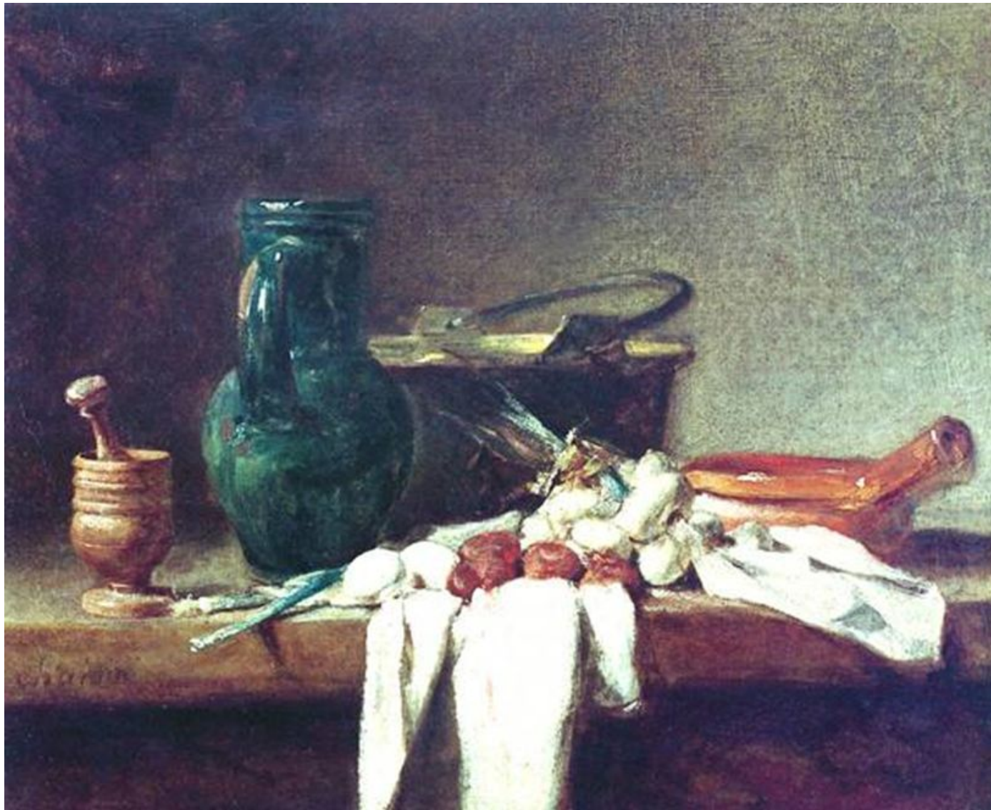
Натюрморт со ступкой и пестиком