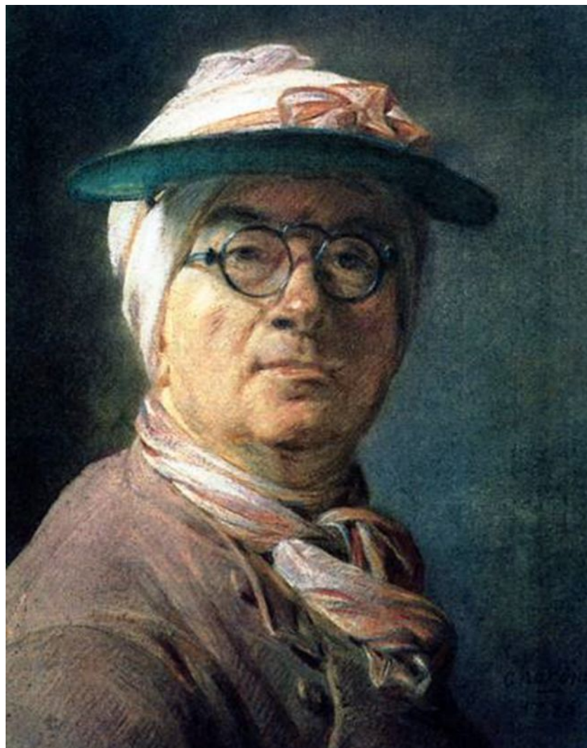
Жан-Батист Симеон Шарден (1699— 1779)