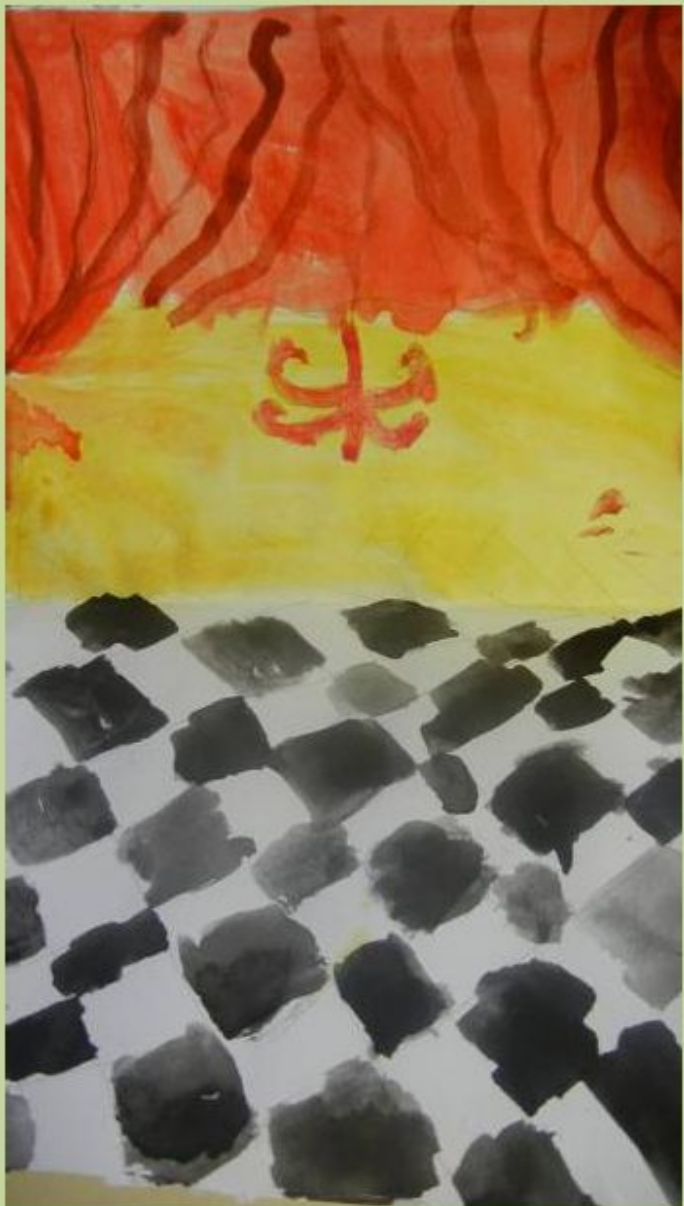
К сказке «Золушка»