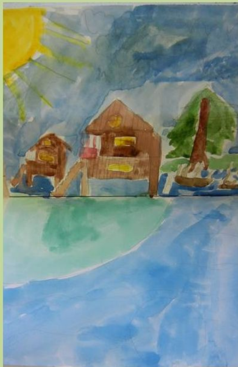
К «Сказке о царе Салтане»