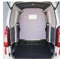
4.7m³大空间,加强型纵梁两纵一横高承载底盘