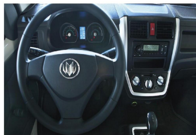
配备EPS助力转向、换挡舒心手