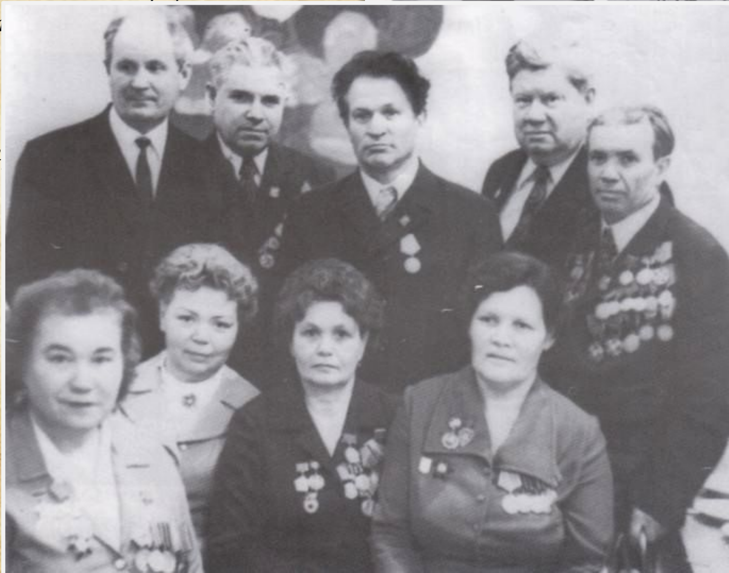
ртов области ской области