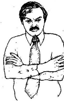
Рис. 69. Здесь заняты твердые позиции.