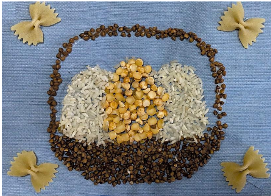
Лесик Полина 6 лет