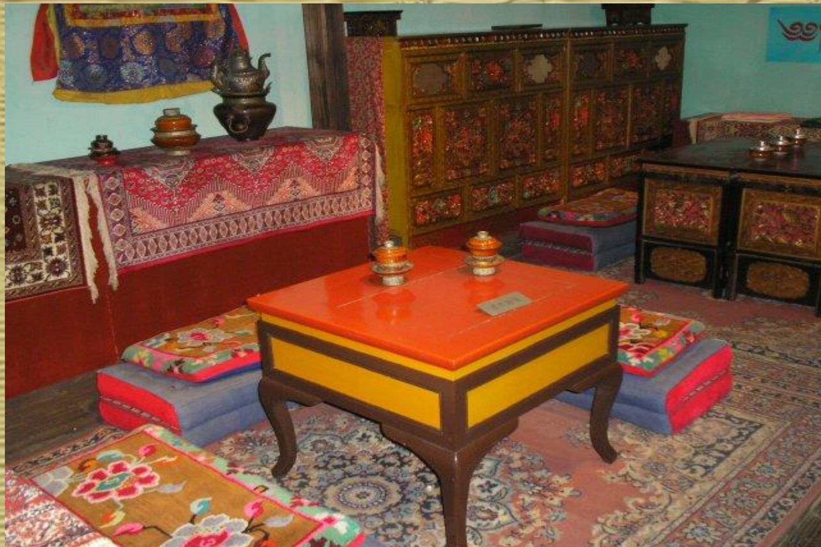
Музей чая. Тибетский чайный ДОМИК