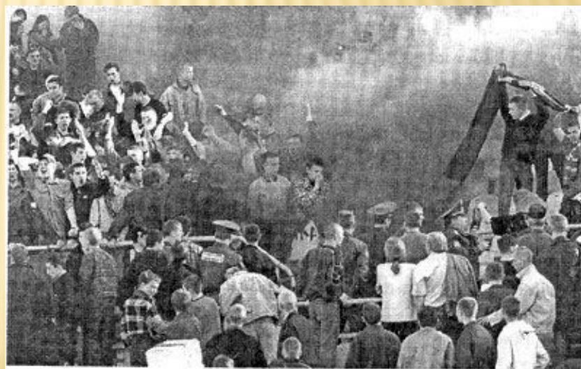
Экспрессивная толпа, превращающаяся в агрессивную.