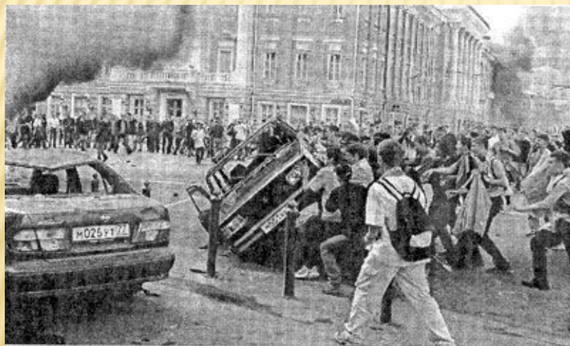
Июнь 2002 года: беспорядки на Манежной площади Москвы по окончании телерепортажа о матче сборных команд России и Японии на чемпионате мира по футболу. (Российская сборная проиграла.) Агрессивная толпа. Отчетливо различимо активное ядро, переходящее в «сочувствующую» периферию.