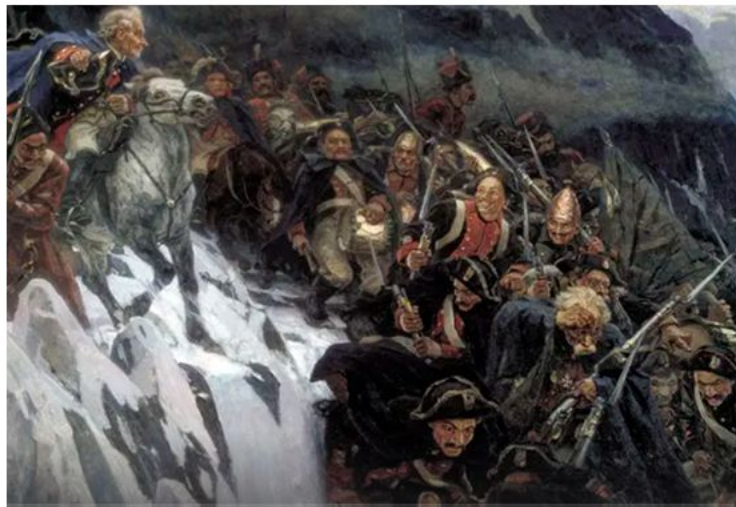
ПЕРЕХОД СУВОРОВА ЧЕРЕЗ АЛЬПЫ 1799