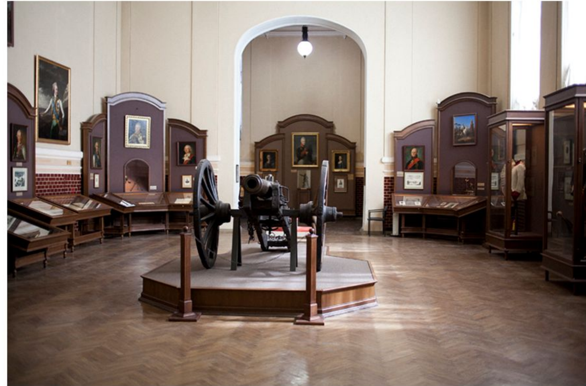
ГОСУДАРСТВЕННЫЙ МЕМОРИАЛЬНЫЙ МУЗЕЙ А. В. СУВОРОВА