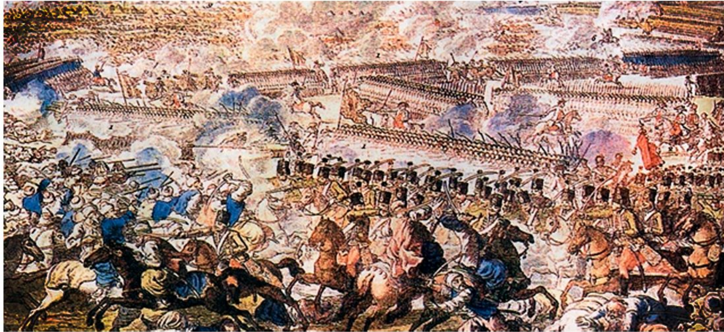
СРАЖЕНИЕ ПРИ РЫМНИКЕ 11 СЕНТЯБРЯ 1789-ГО ГОДА