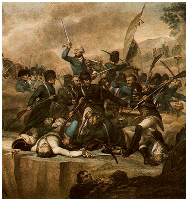
СРАЖЕНИЕ НА РЕКЕ АДДА 15—17 АПРЕЛЯ 1799