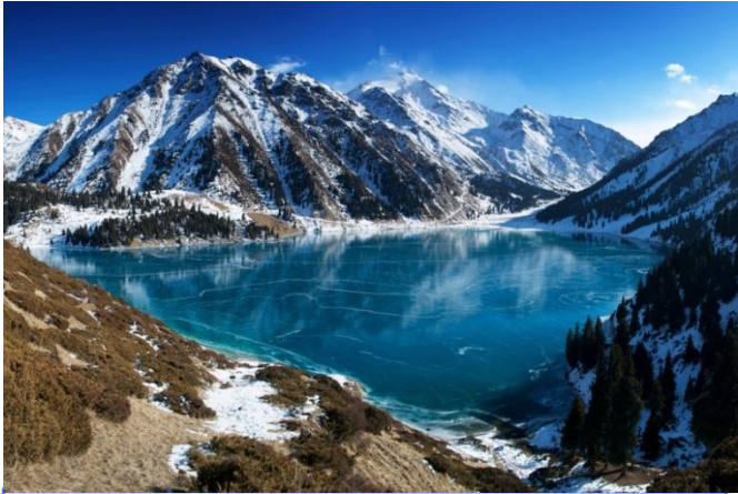
Große Almaty See