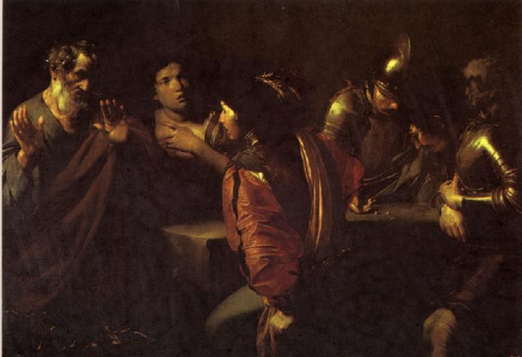
Валантен де Булонь «Отречение Святого Петра»