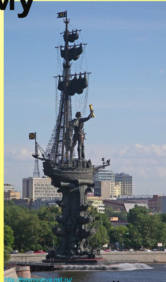
300 -летию российского флота