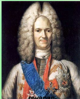
генерал-фельдмаршал светлейший князь Александр Данилович Меншиков

Председателем Совета стала императрица Екатерина I