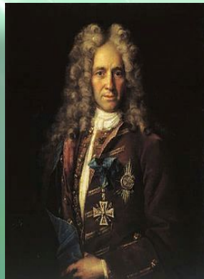
Государственный канцлер граф Гавриил Иванович Головкин