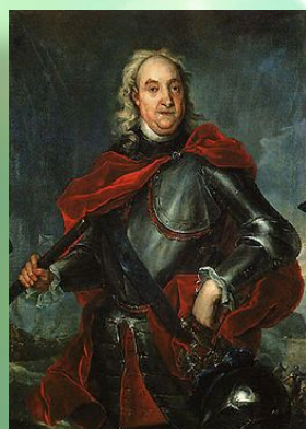
генерал-адмирал граф Фёдор Матвеевич Апраксин