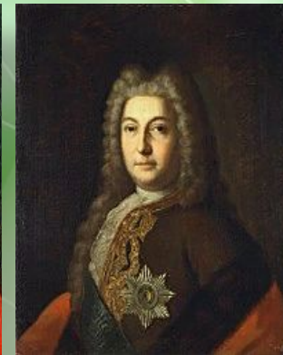
барон Андрей Иванович Остерман

По завещанию Екатерины I, Совету на время малолетства Петра II предоставлялась власть, равная власти государя; только в вопросе о порядке престолонаследия Совет не мог делать перемен