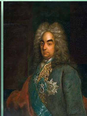
граф Пётр Андреевич Толстой