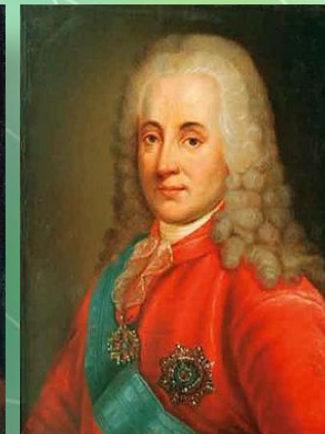
князь Дмитрий Михайлович Голицын