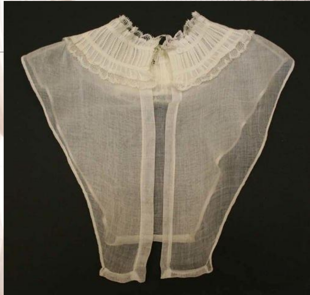
Шемизетка – прикрыть декольте бального платья для не бала.