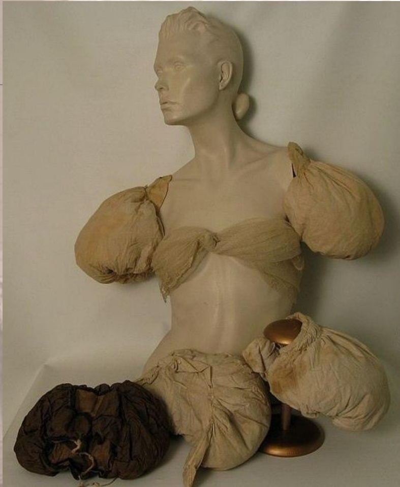
Подрукавники для объемных рукавов 1820-х.