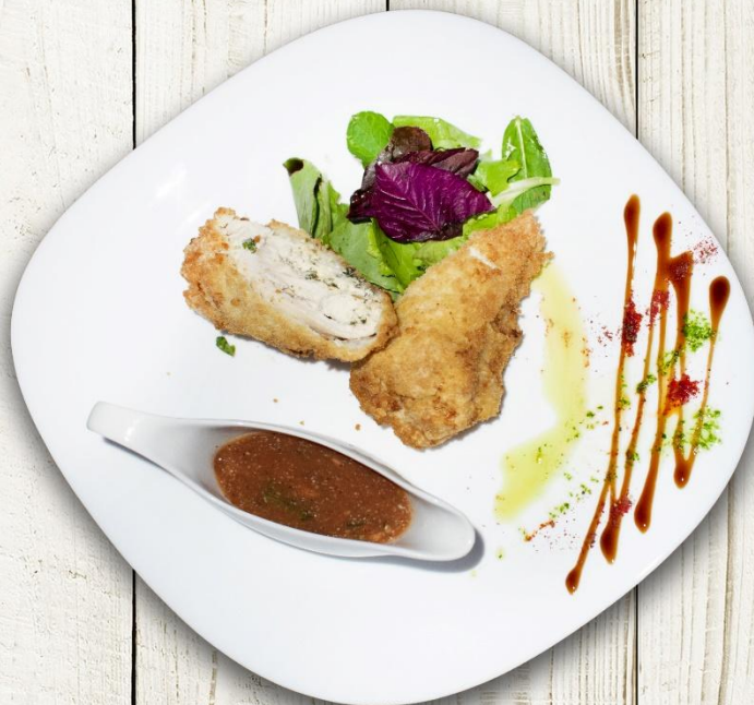
КУРОЧКА С СЕКРЕТОМ