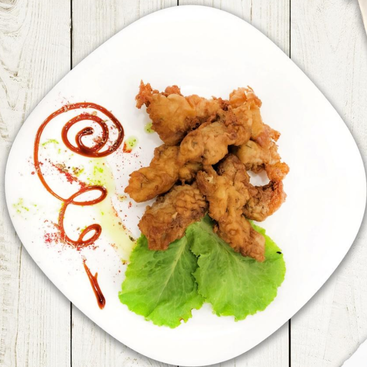
МОРСКОЙ ЯЗЫК В КЛЯРЕ