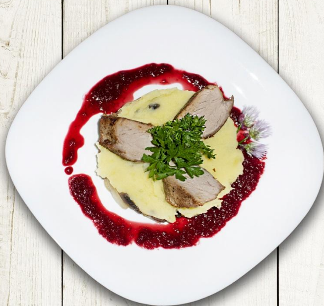
СВИНИНА ОТ ШЕФА