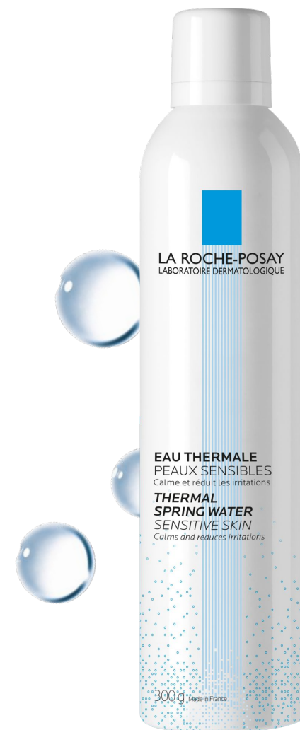
Термальная Вода Средство ухода за чувствительной кожей