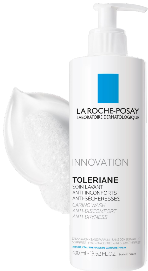
Толеран Очищающий крем-гель для чувствительной