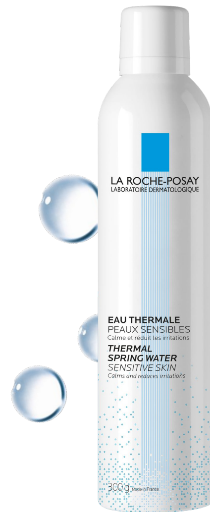
Термальная Вода Средство ухода за чувствительной кожей