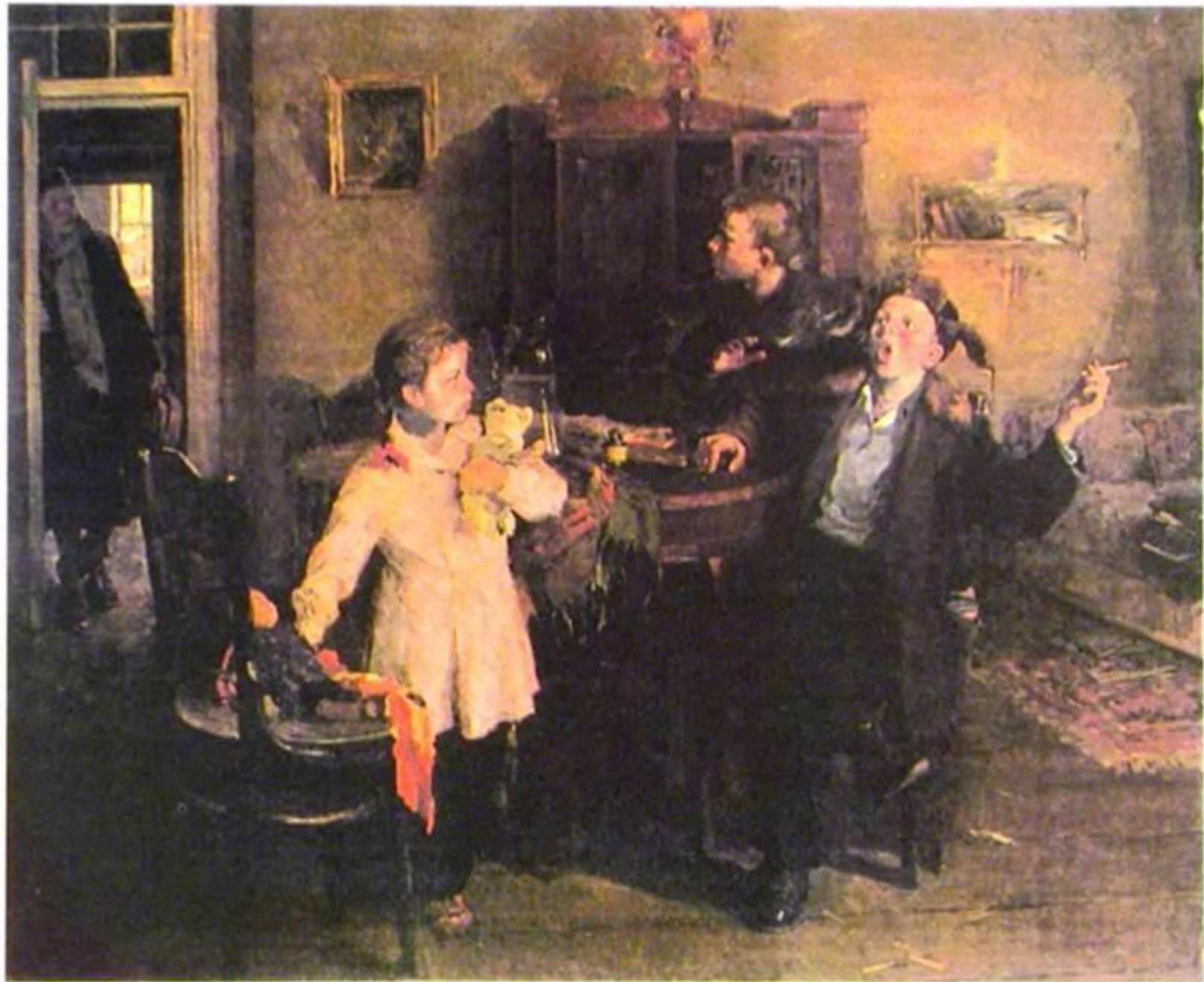
Объяснение сюжетных картин