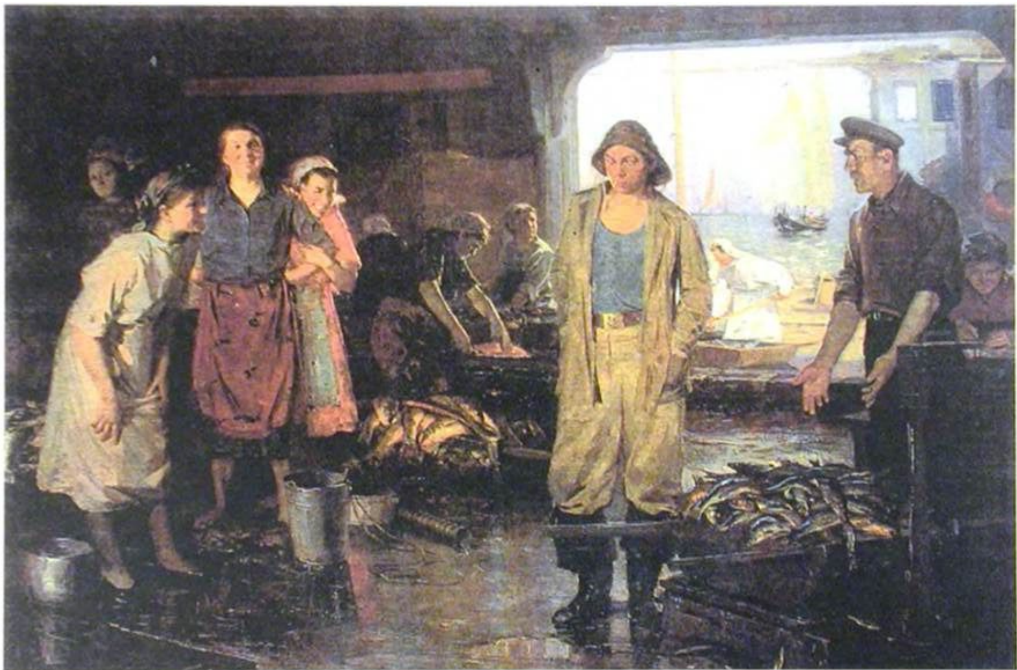
Объяснение сюжетных картин