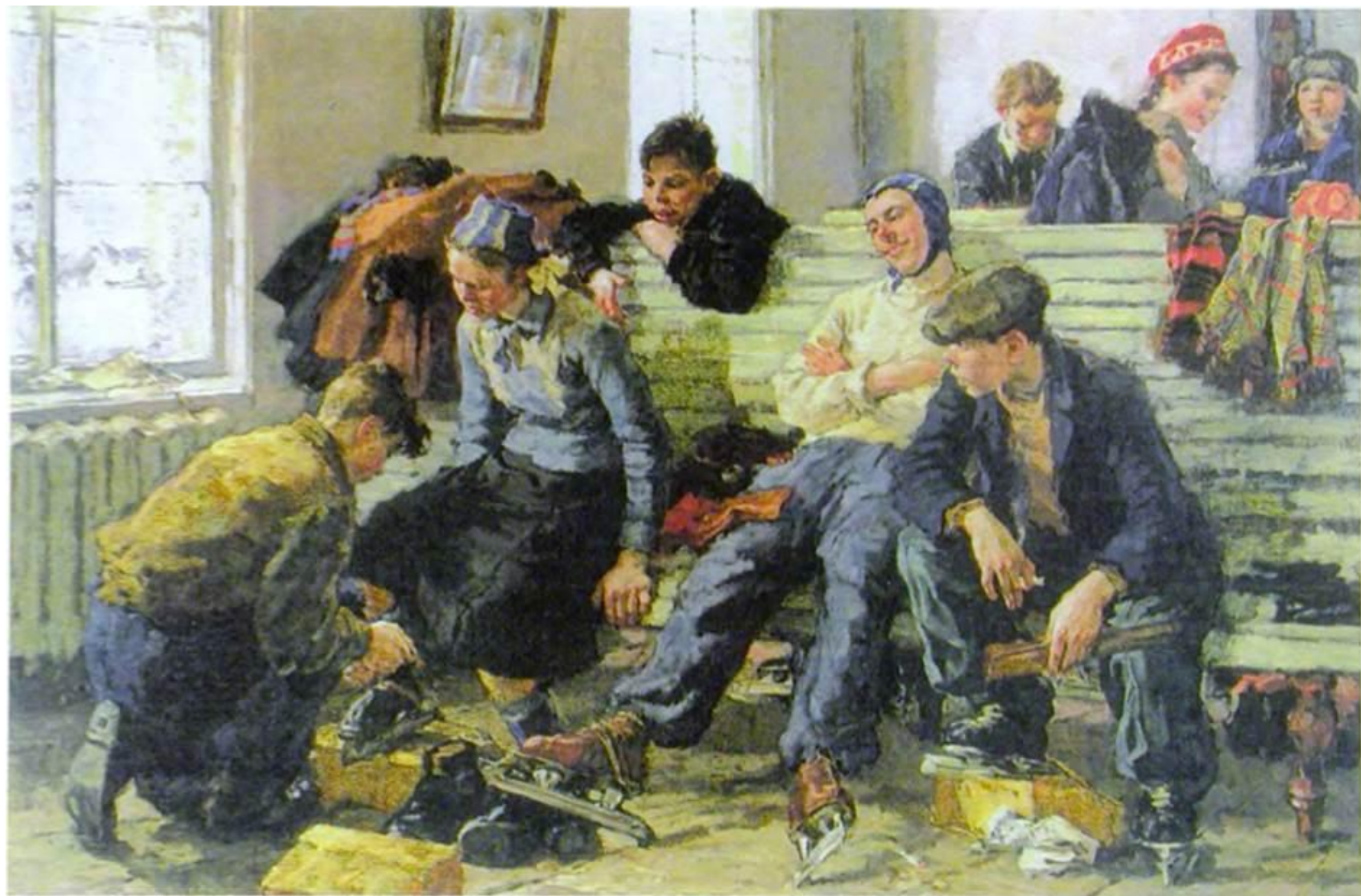
Объяснение сюжетных картин