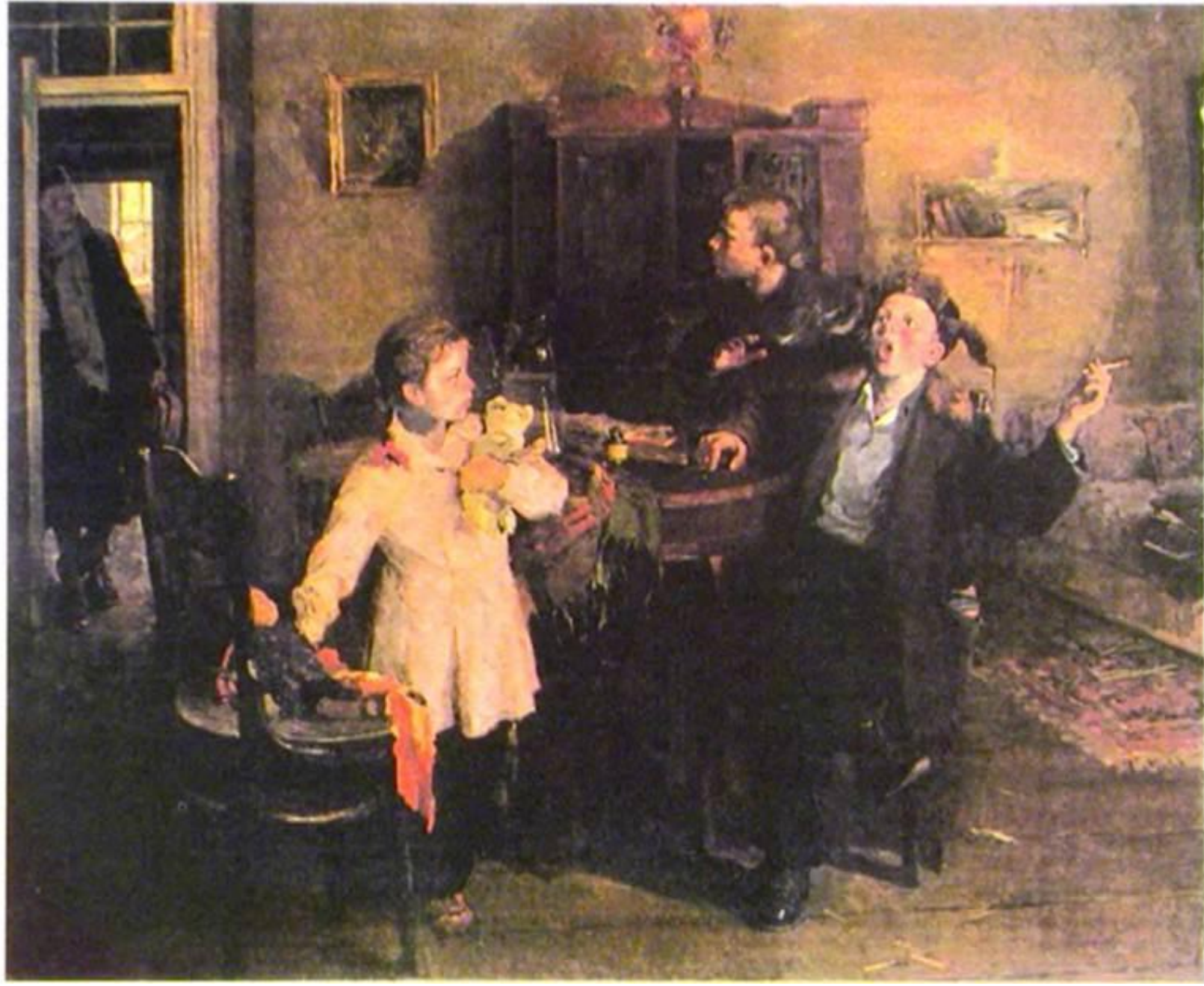
Объяснение сюжетных картин