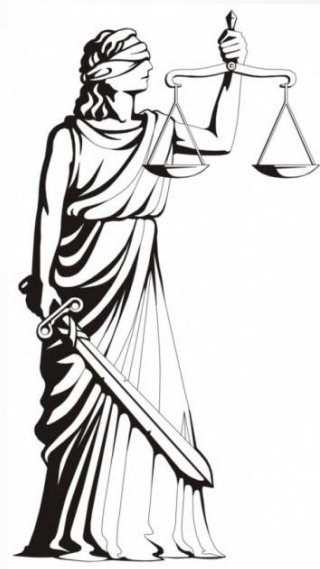
Фемида – богиня правосудия и порядка