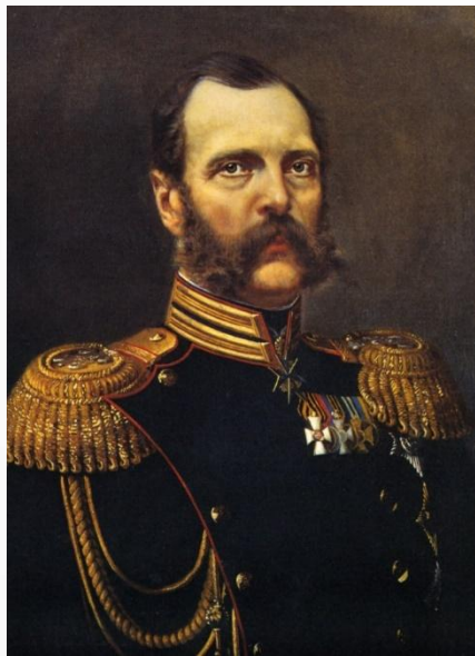
Александр II (Александр Николаевич Романов) (1818 - 1881)

«Конституция» М. Т. Лорис-Меликова (1881)