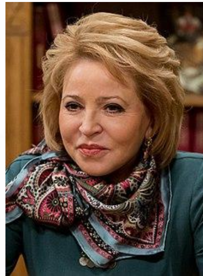
Валентина Ивановна Матвиенко – Председатель Совета Федерации Федерального Собрания РФ