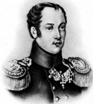
П. И. Пестель (1793 - 1826)