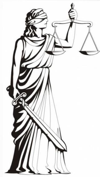
Фемида – богиня правосудия и порядка