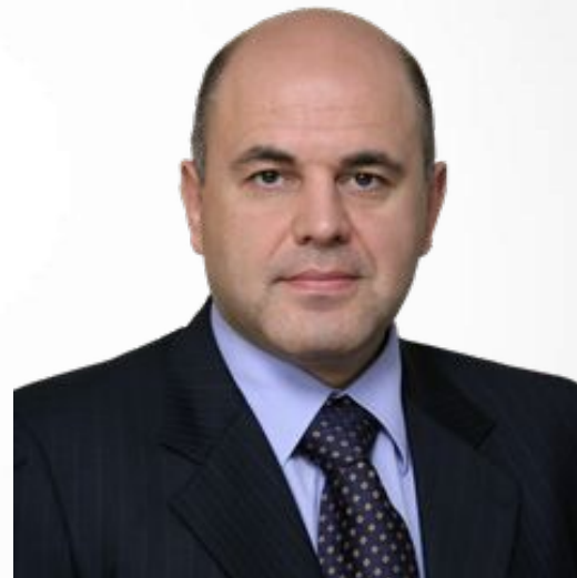
Михаил Владимирович Мишустин