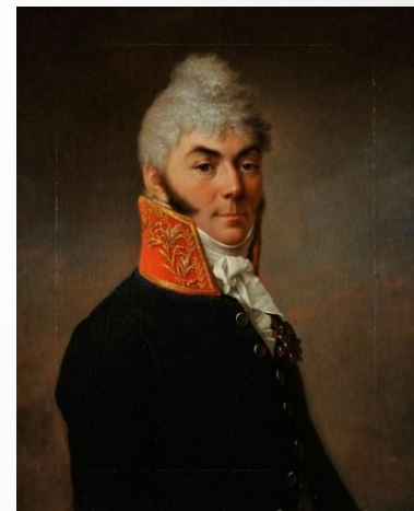
Н. Н. Новосильцев (1761 - 1838)