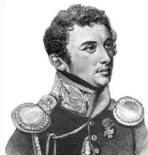
Н. М. Муравьев (1795 - 1843)