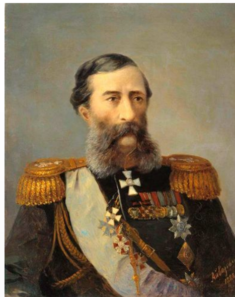
Лорис-Меликов Михаил Тариелович (1824-1888)