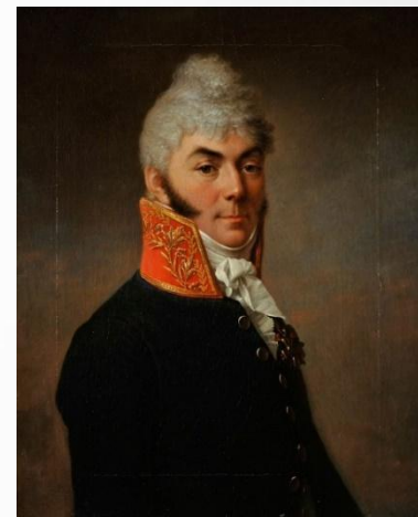
Н. Н. Новосильцев (1761 - 1838)