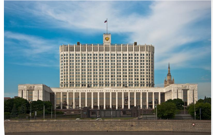
Дом Правительства РФ