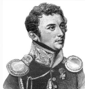
Н. М. Муравьев (1795 - 1843)