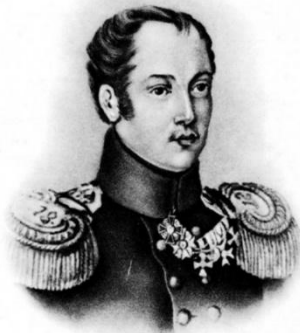
П. И. Пестель (1793 - 1826)