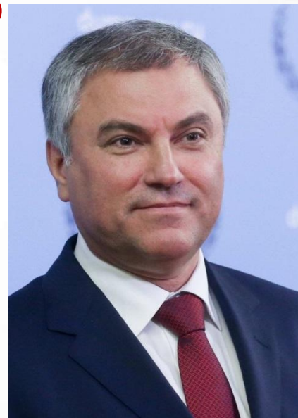
Вячеслав Викторович Володин Председатель Государственной Думы Федерального Собрания РФ 7-го