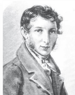
С. П. Трубецкой (1790-1860)