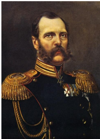
Александр II (Александр Николаевич Романов) (1818 - 1881)

«Конституция» М. Т. Лорис-Меликова (1881)