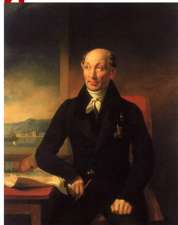
М. М. Сперанский (1772 - 1839)