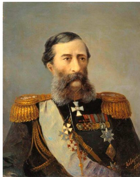
Лорис-Меликов Михаил Тариелович (1824-1888)