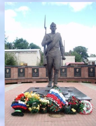
Экскурсии по городам