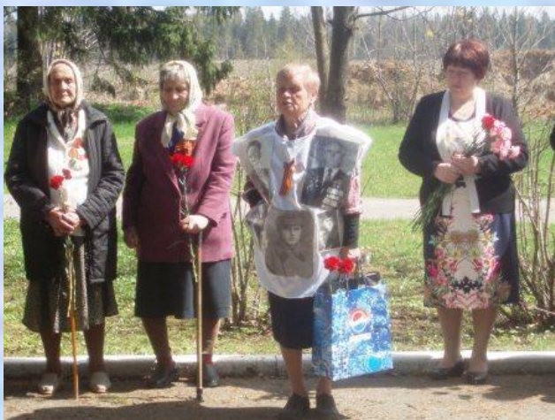
Встреча с ветеранами «Дети войны»