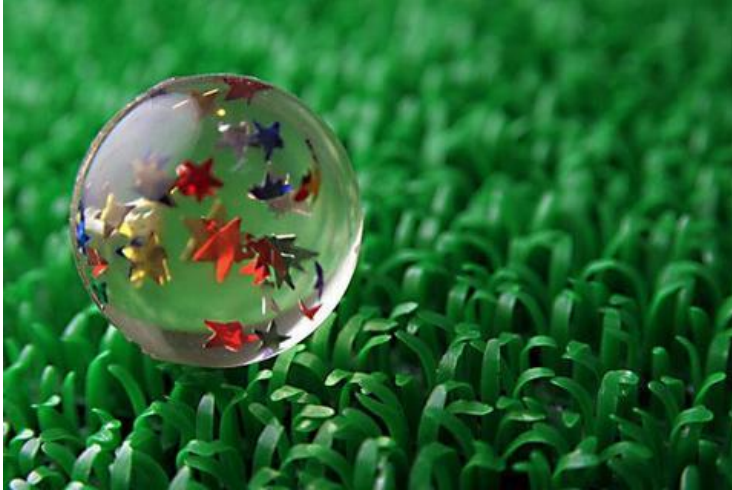
Современная замена пластиком натуральных материалов

История пластмассы очень захватывающая. Ниже приведены даты самых важных событий в истории пластика за последние 150 лет. Обратите внимание на то, как много видов пластика имеют знакомые названия, как например тефлон и пенопласт. Что более интересно, так это то, сколько известных видов пластика на самом деле были обнаружены случайно!