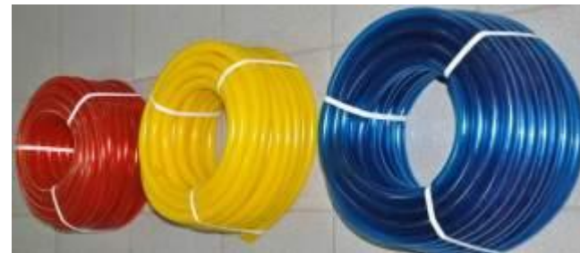
Шланги для полива.