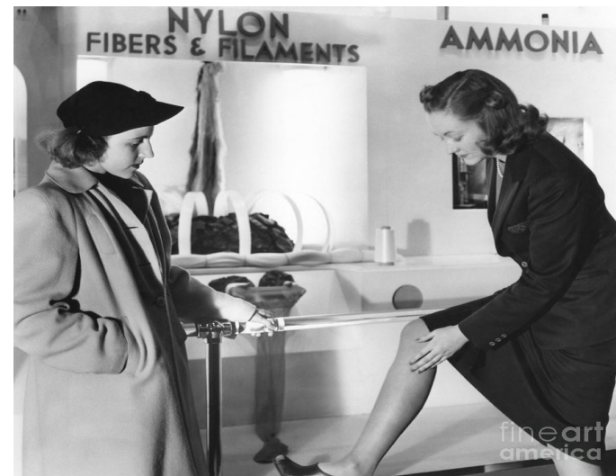
Демонстрация нейлоновых чулок.

В 1939 году американская компания, в которой работал учёный впервые объявила и продемонстрировала нейлон и нейлоновые чулки американской общественности на Всемирной выставке в Нью-Йорке. Нейлон применяется для изготовления лески, хирургической нити и зубной щетки;