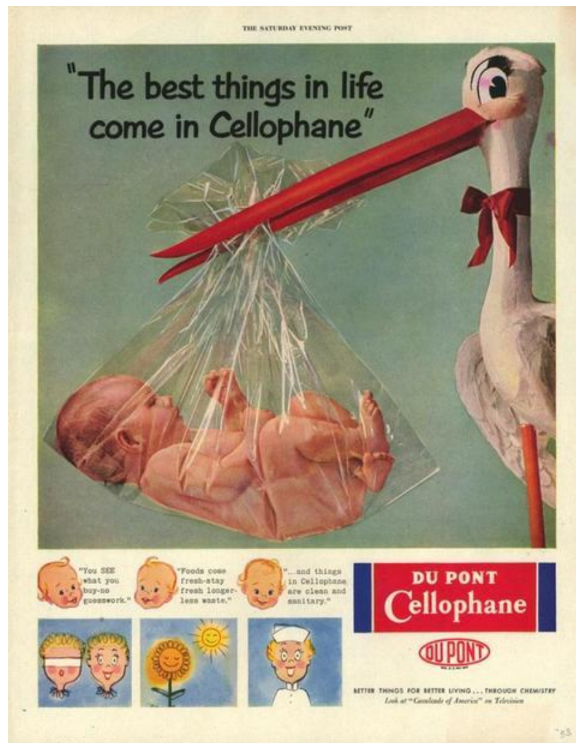
Первая реклама целлофана

В 1908 году он разработал первую машину по производству прозрачных листов регенерированной целлюлозы. Первым клиентом Жака стала американская компания по производству конфет, которая решила использовать целлофан для обертывания шоколада;