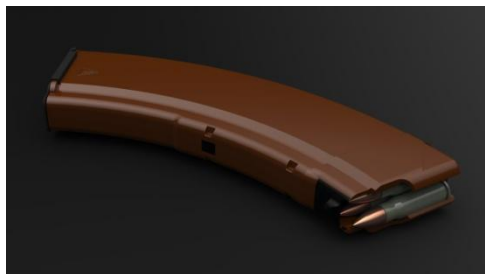
Магазин Автомата Калашникова.

Он был разработан химиком Лео Бекеландом, уроженцем Бельгии, проживавшим в Нью-Йорке. Бакелит, благодаря его низкой электрической проводимости и термостойким свойствам применяется в электрических изоляторах, корпусах для радио и телефонов и в таких разнообразных изделиях, как посуда, ювелирные изделия, трубы и детские игрушки;