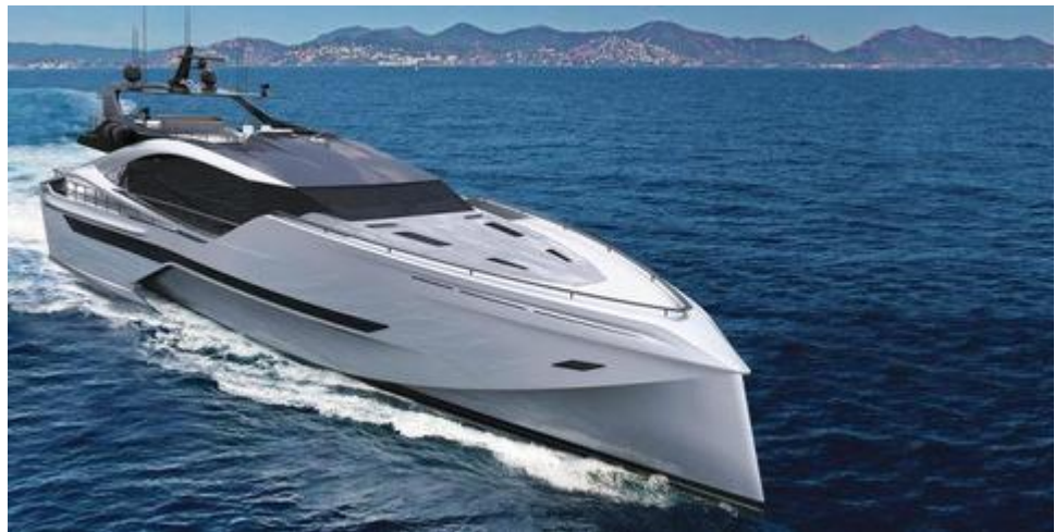
Яхта (корпус из карбона)