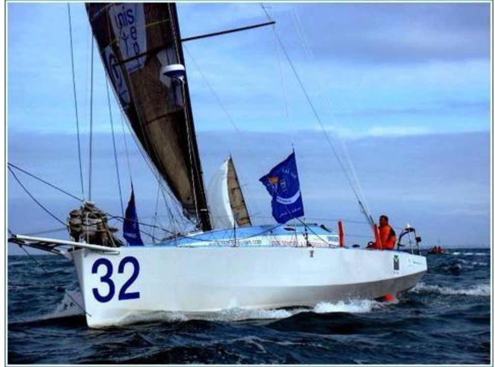
Лодка с наружным покрытием из стеклопластика

Из стеклопластиков в частности изготавливают трубы, выдерживающие большое гидравлическое давление и не подвергающиеся коррозии, корпуса ракетных двигателей твёрдого топлива (РДТТ), лодки, корпуса маломерных судов и многое другое.