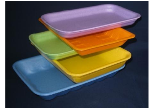
Упаковка для пищевых продуктов.