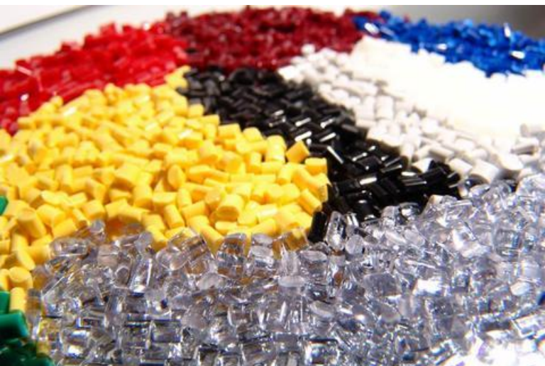
Пластмасса в гранулах для производства изделий.