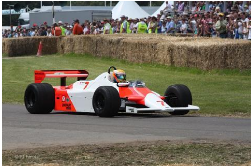
Гоночный автомобиль (кузов из карбона)

Углепластики широко используются при изготовлении лёгких, но прочных деталей, заменяя собой металлы, во многих изделиях от частей космических кораблей до удочек.