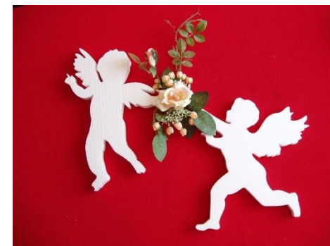
Декоративные элементы интерьера.