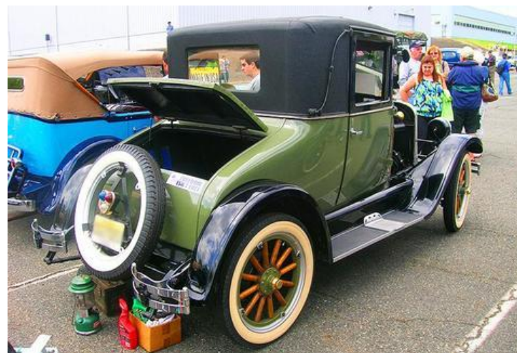
Раритетный (старинный) автомобиль «Chevrolet» 1926 года покрытый винилом

Винил был изобретен в США Вальтером Симоном, исследователем из компании по производству компонентов для самолетов «B.F. Goodrich». Впервые материал был использован в шарах для гольфа и каблуках. Сегодня винил является вторым самым производимым пластиком в мире и используется во многих изделиях, таких как занавески для душа, плащи, провода, различные приборы, напольная плитка, краски и поверхностные покрытия;