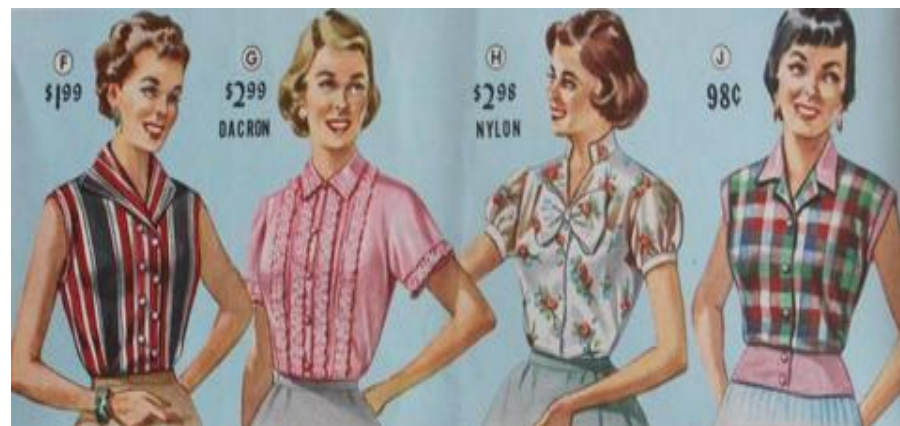
Летние блузки из нейлона