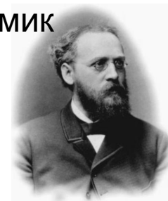
Фото. Немецкий химик Евгений Бауман.

Впервые поливинилхлорид был создан немецким химиком Евгением Бауманом, который так и не запатентовал свое открытие. В 1913 году его соотечественник Фридрих Клатте изобрел новый метод полимеризации винилхлорида с использованием солнечного света. Именно он стал первым изобретателем, который получил патент на поливинилхлорид.