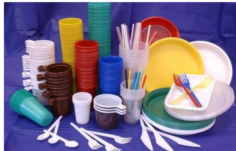
Посуда одноразового использования