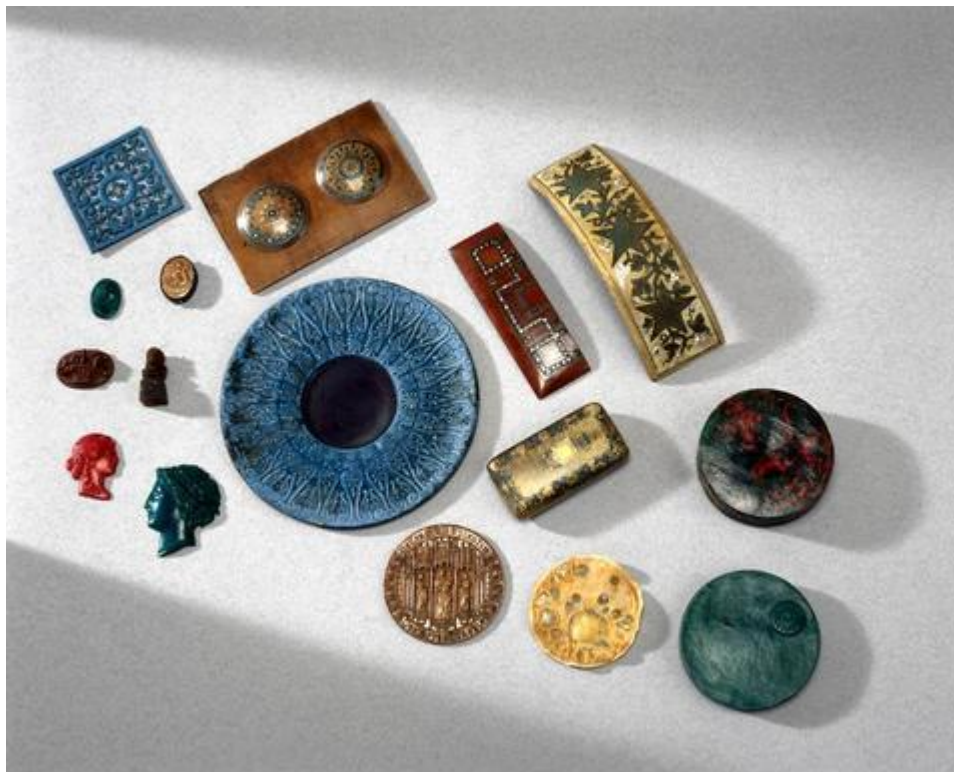
Первые изделия из паркезина.

Паркезин - первый искусственный пластик, который был создан Александром Парксом в Лондоне и представлял собою органический материал, полученный из целлюлозы. После нагревания и придания формы его охлаждали и он сохранял полученную форму.