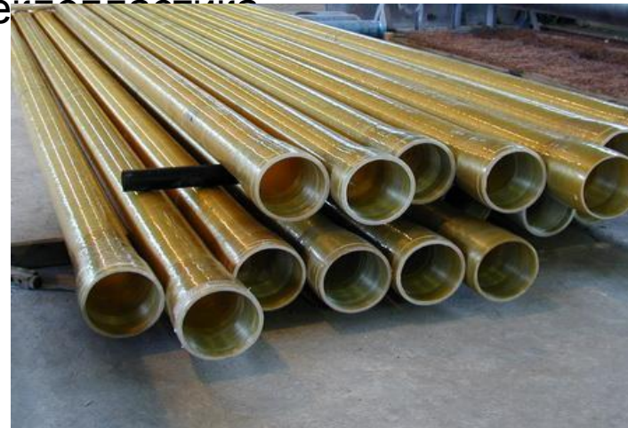
Трубы из стеклопласти ка