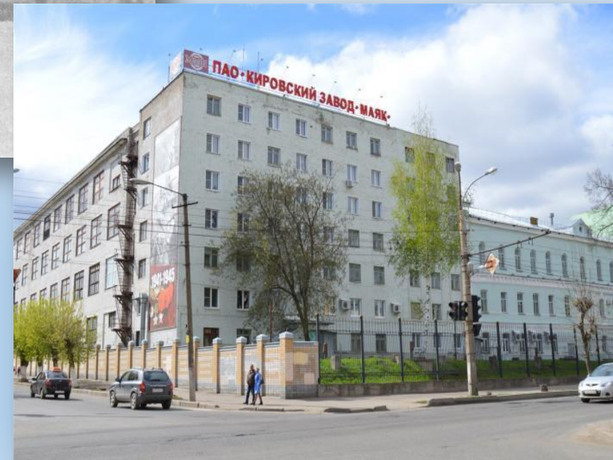
Завод «Маяк» г. Киров