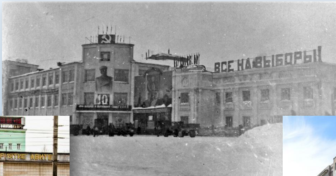
Завод «Лепсе» г. Киров