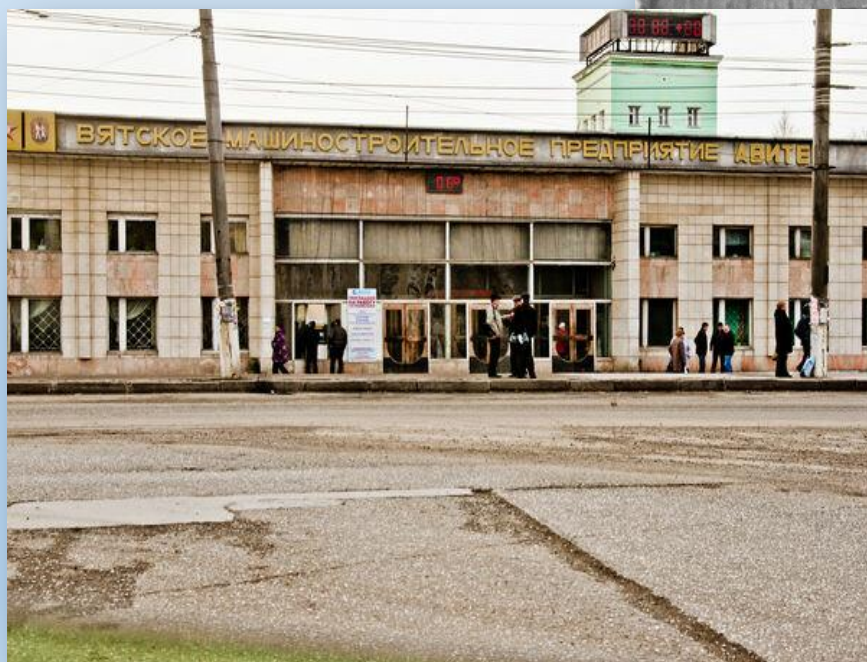
Завод «Авитек» г. Киров