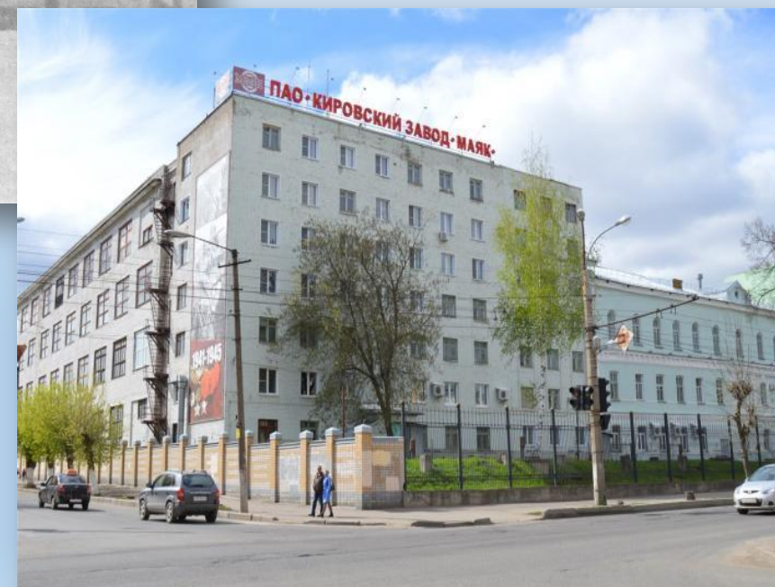
Завод «Маяк» г. Киров