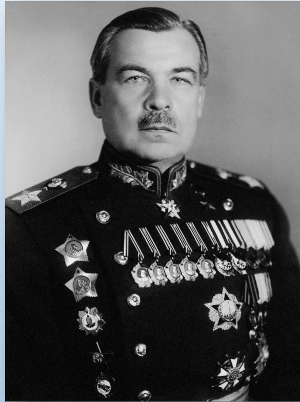
Говоров Леонид Александрович