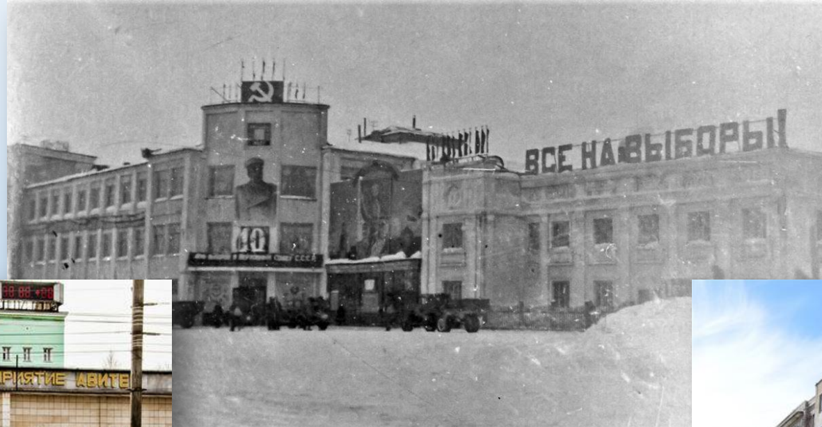
Завод «Лепсе» г. Киров