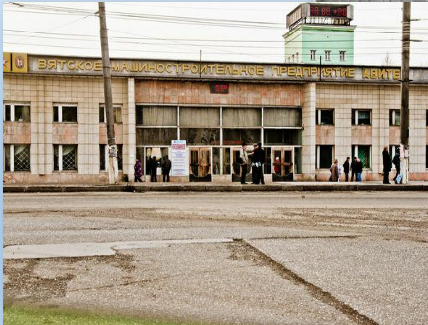
Завод «Авитек» г. Киров