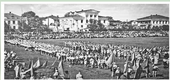
Празднование выпускного вечера. г. Киров, 1943 год