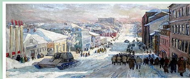
Г. Гладышева. Город Киров в годы войны. 1943 год.