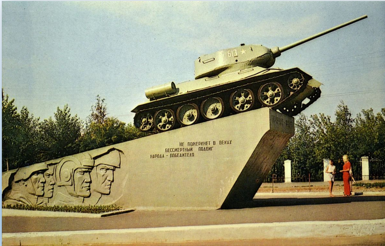
Памятник «Кировчане – фронту»