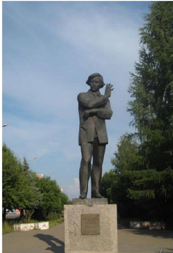
Памятник И.С. Ключникову-Палантаю. Бульвар Чавайна, г. Йошкар-Ола