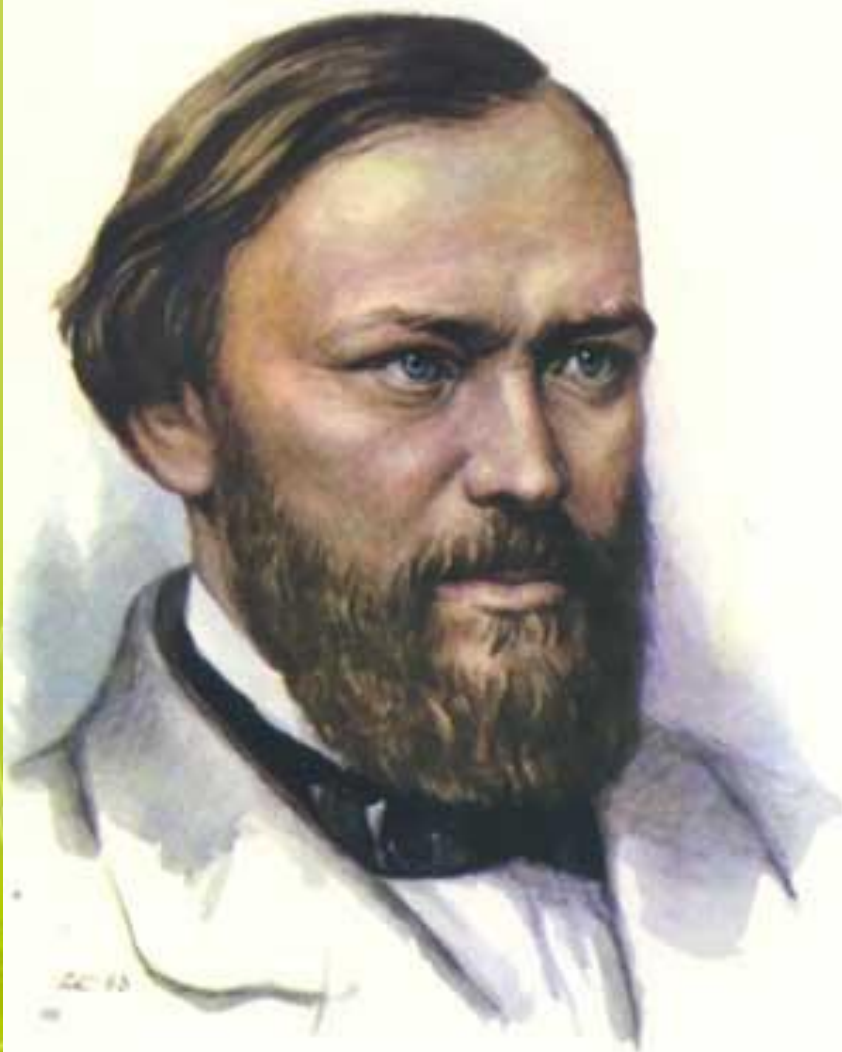
Александр Николаевич Островский (1823—1886)