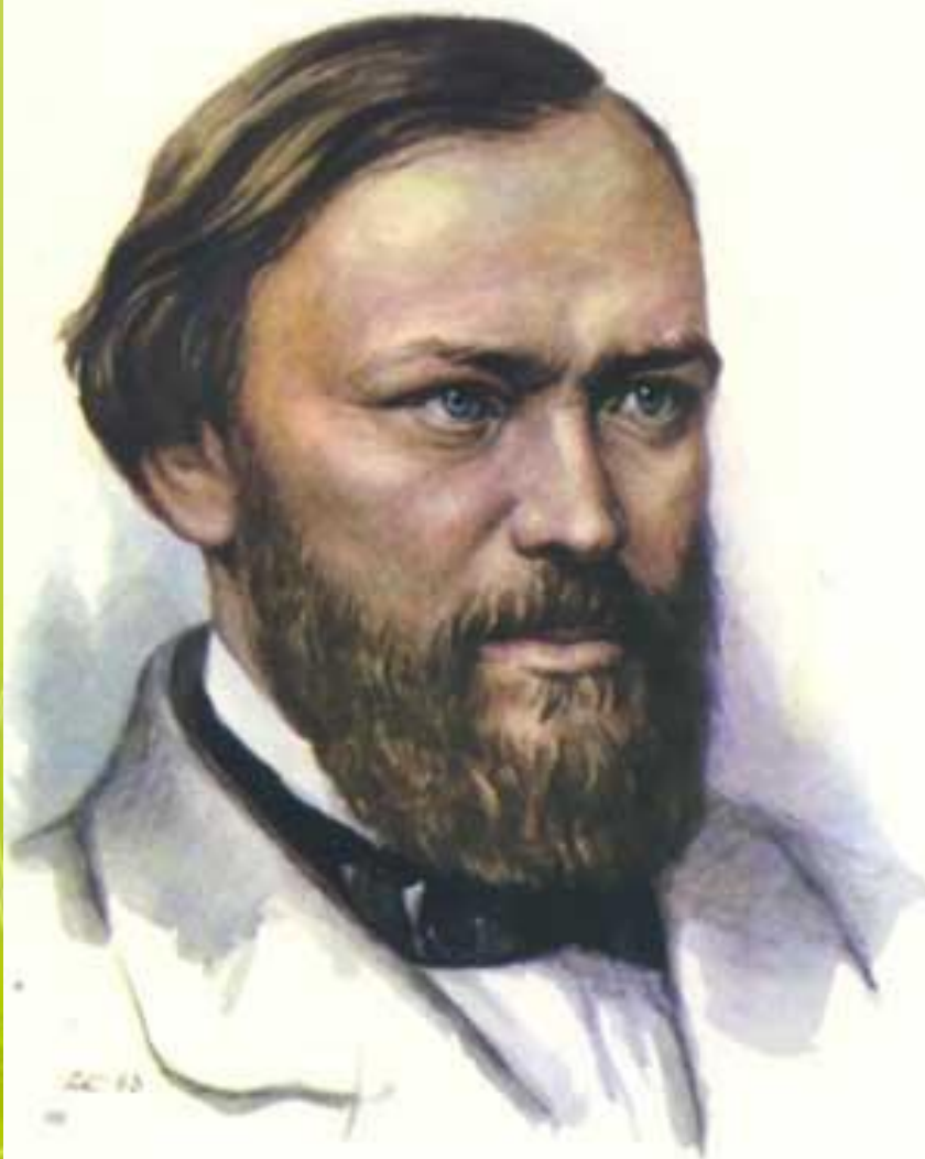
Александр Николаевич Островский (1823—1886)