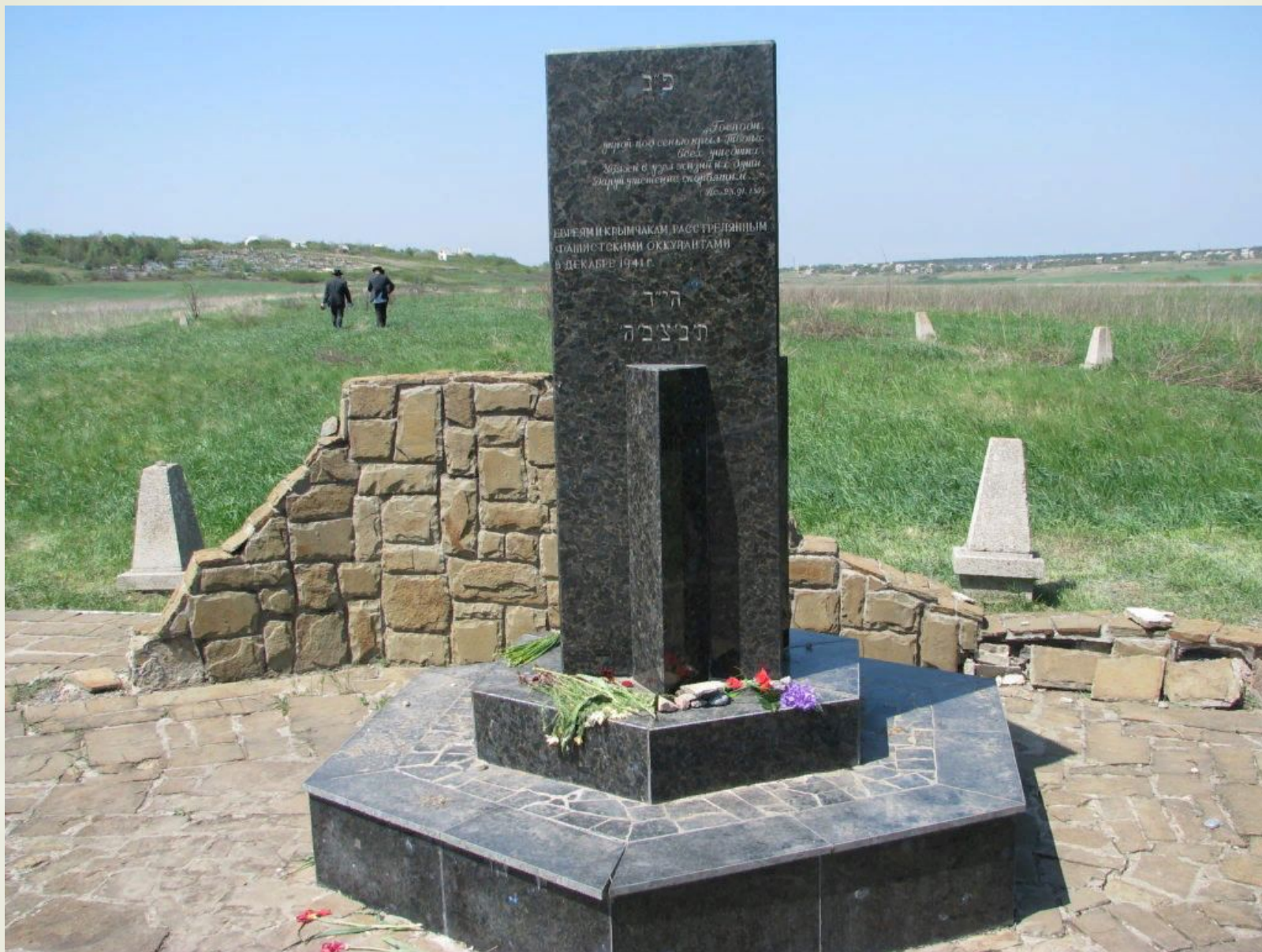
Памятник жертв нацизма в Керчи