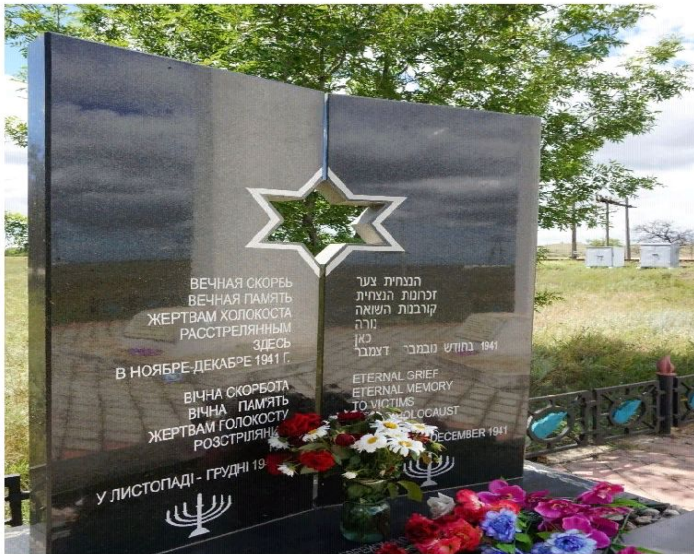
Памятник посвященный жертвам расстрела в Багеровском рву