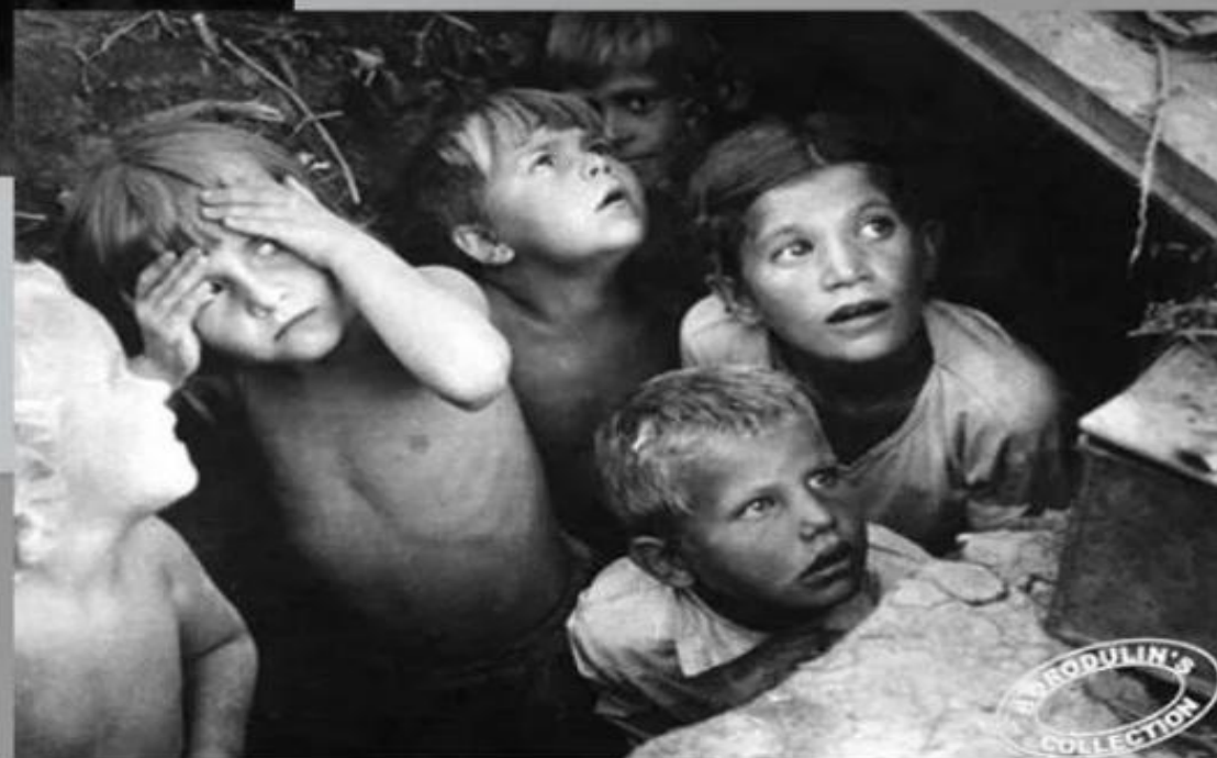
Дети во время бомбежки