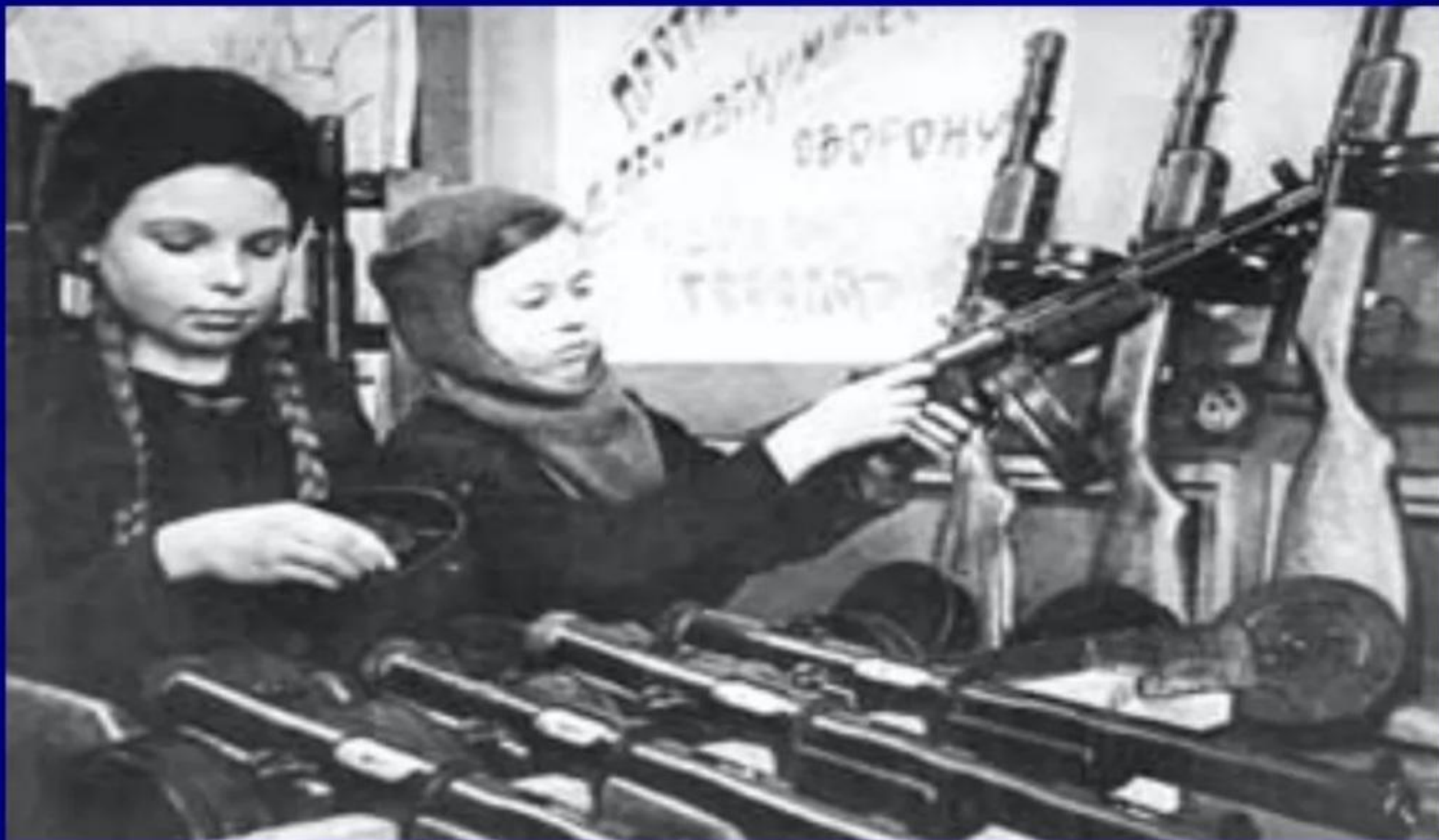
ДЕТИ В БЛОКАДНОМ ЛЕНИНГРАДЕ СОБИРАЮТ ПУЛЕМЕТЫ