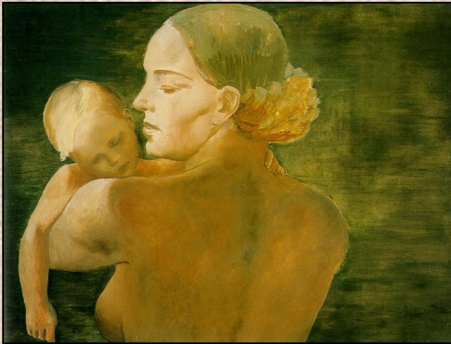
А. Дейнека « Мать »