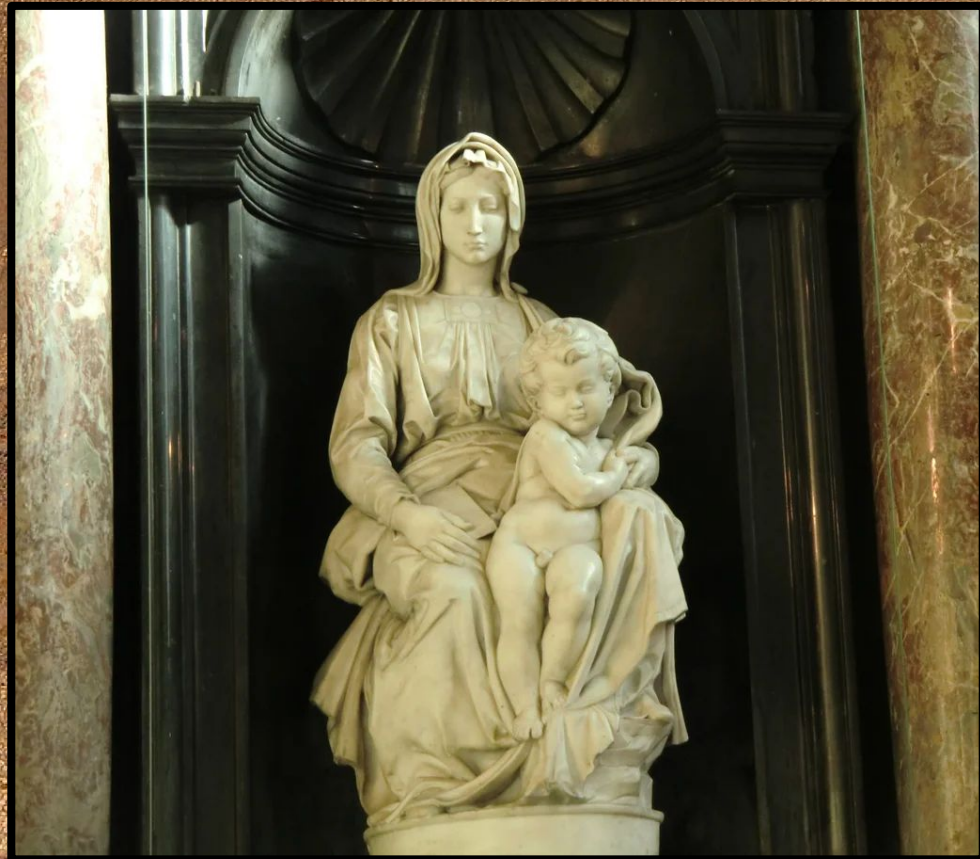
|Madonna di Bruges| - Biserica Maicii Domnului, Bruges