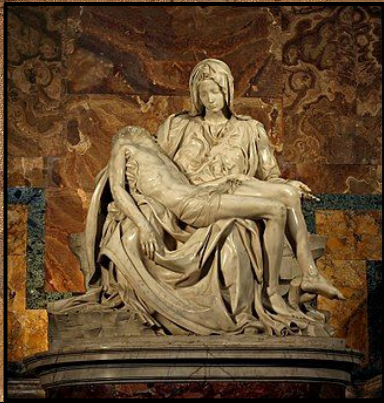
|Pieta| - Catedrala Sf. Petru