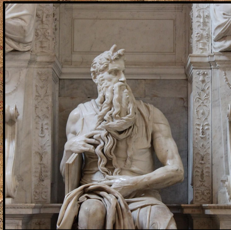
|Moisei| - San-Pietro-in-Vincoli