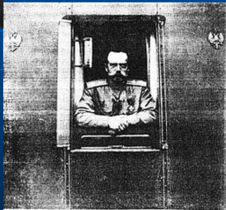
Государь Императоръ Николай II послѣ отреченія.