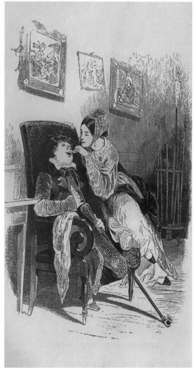
– Разинь, душенька, свой ротик, я тебе положу этот кусочек. Рисунок А. Агина к поэме Н. В. Гоголя «Мертвые души». 1892 г.

В-третьих – это неопределенность, пронизывающая весь образ Манилова, отсутствие яркой индивидуальности. Не случайно ему постоянно сопутствует серо-голубой цвет