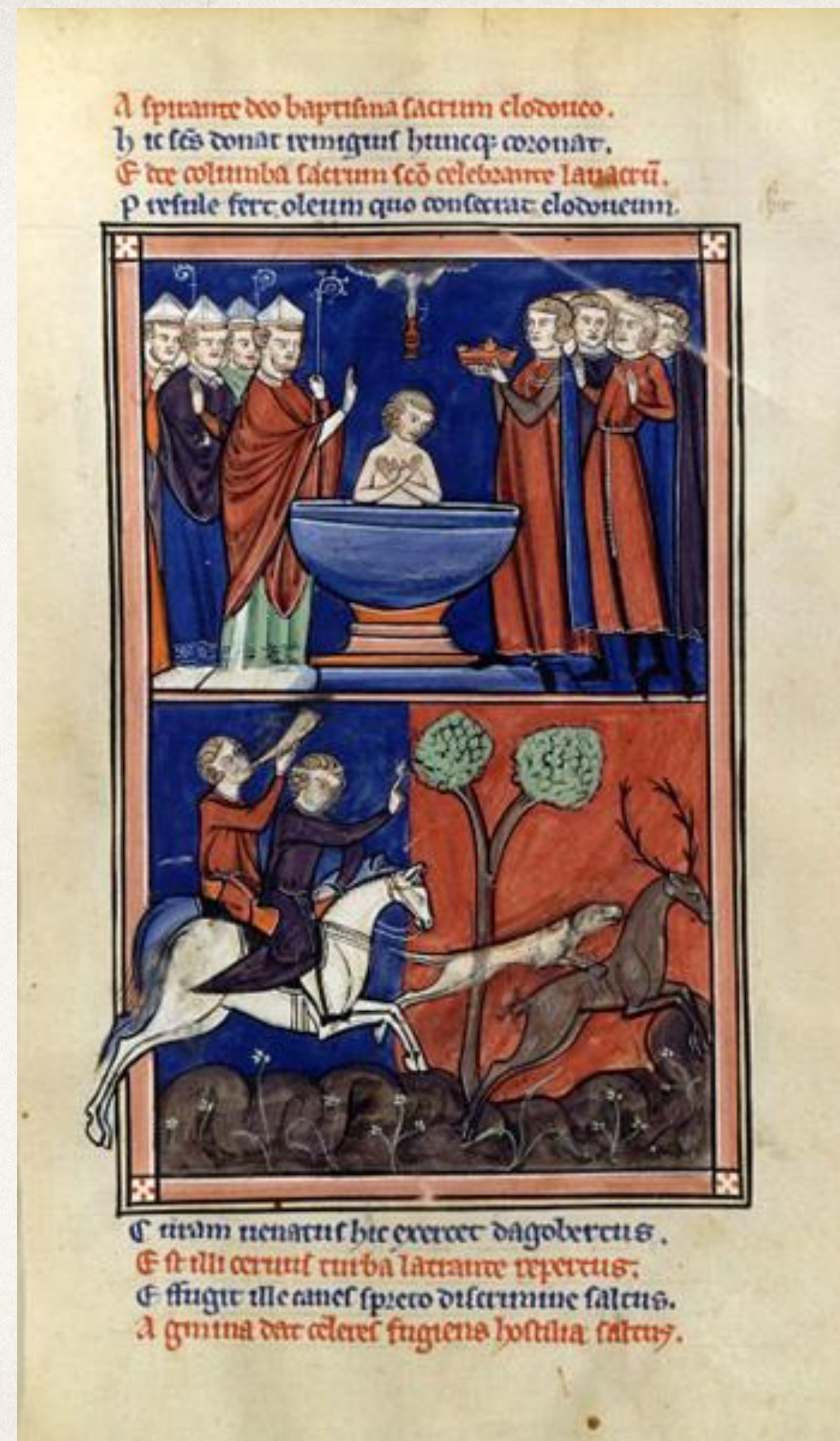
Крещение Хлодвига. Миниатюра XIII века

Язычество исчезало постепенно, уступая место христианству. Тогда стали принимать христианство и варвары. Согласно легенде, король франков Хлодвиг крестился по настоянию своей жены Клотильды