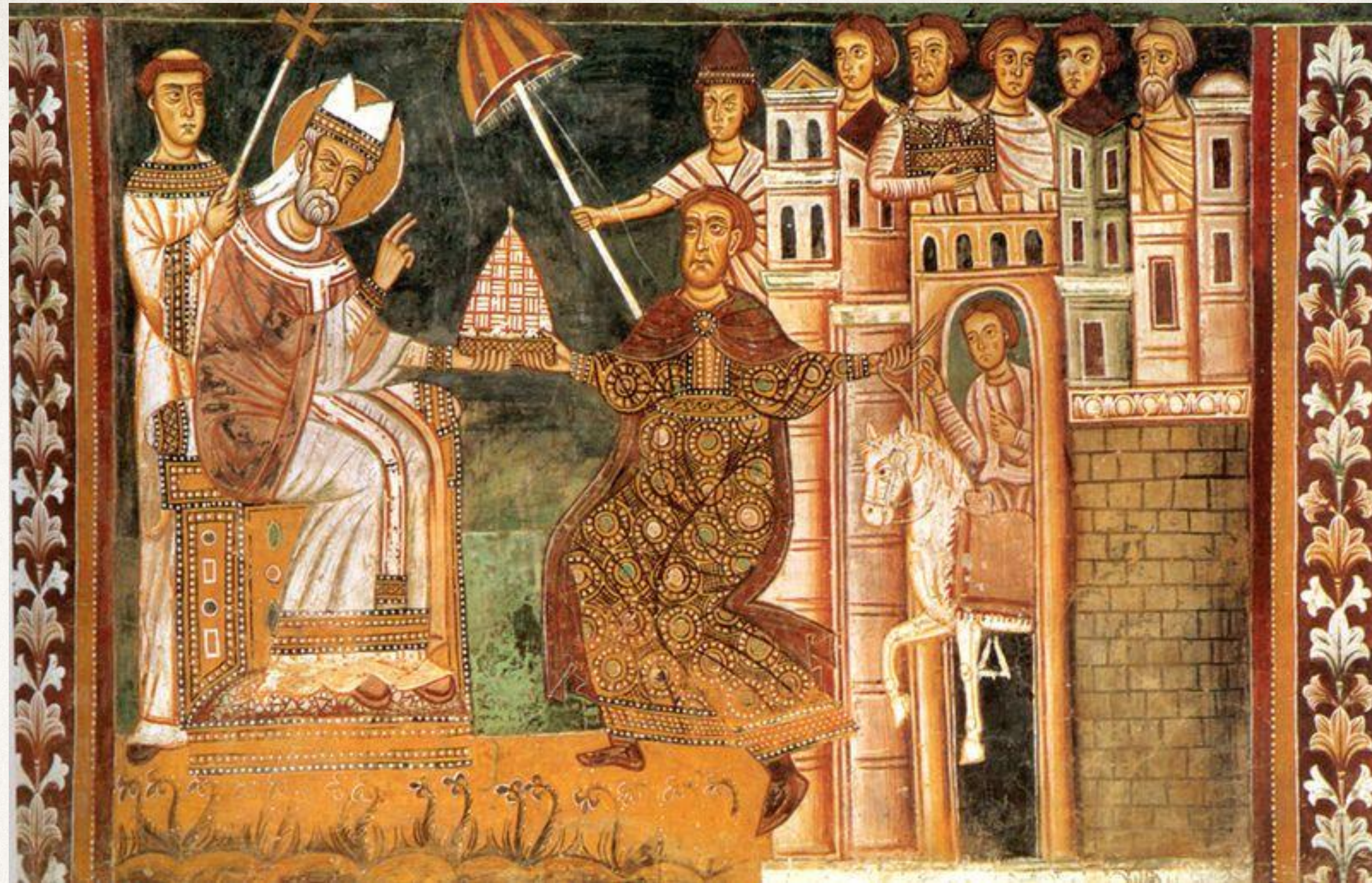
Средневековая фреска, изображающая императора Константина во время церемонии дарения в римской церкви Санти-Кватро Коронати

В 313 году римский император Константин Великий издал указ, согласно которому христианам разрешалась свобода вероисповедания и они уравнивались в правах с язычниками.