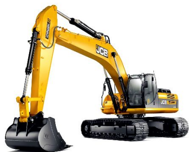
Колесные и гусеничные экскаваторы