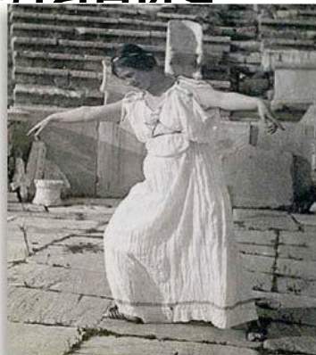
At the Theatre of Dionysus, Athens — 1903