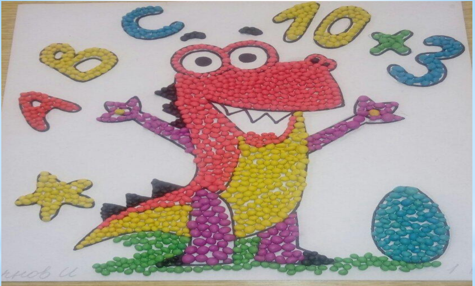
«Мой помощник Гриша!»- Чернов Илья 1 Б класс