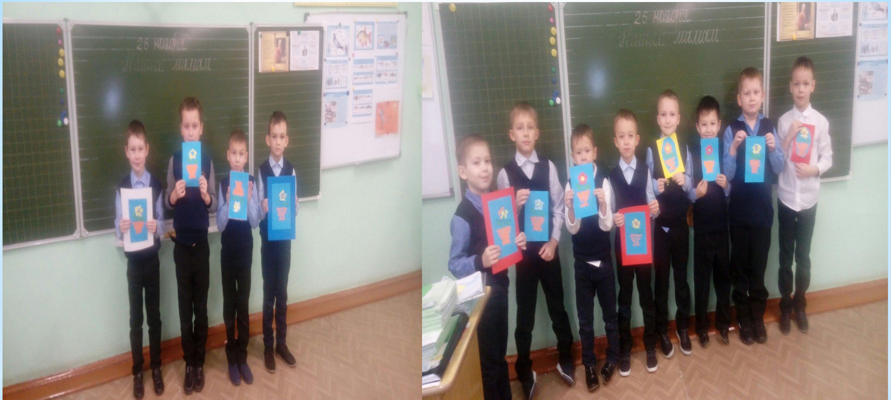
Наши работы к Дню матери