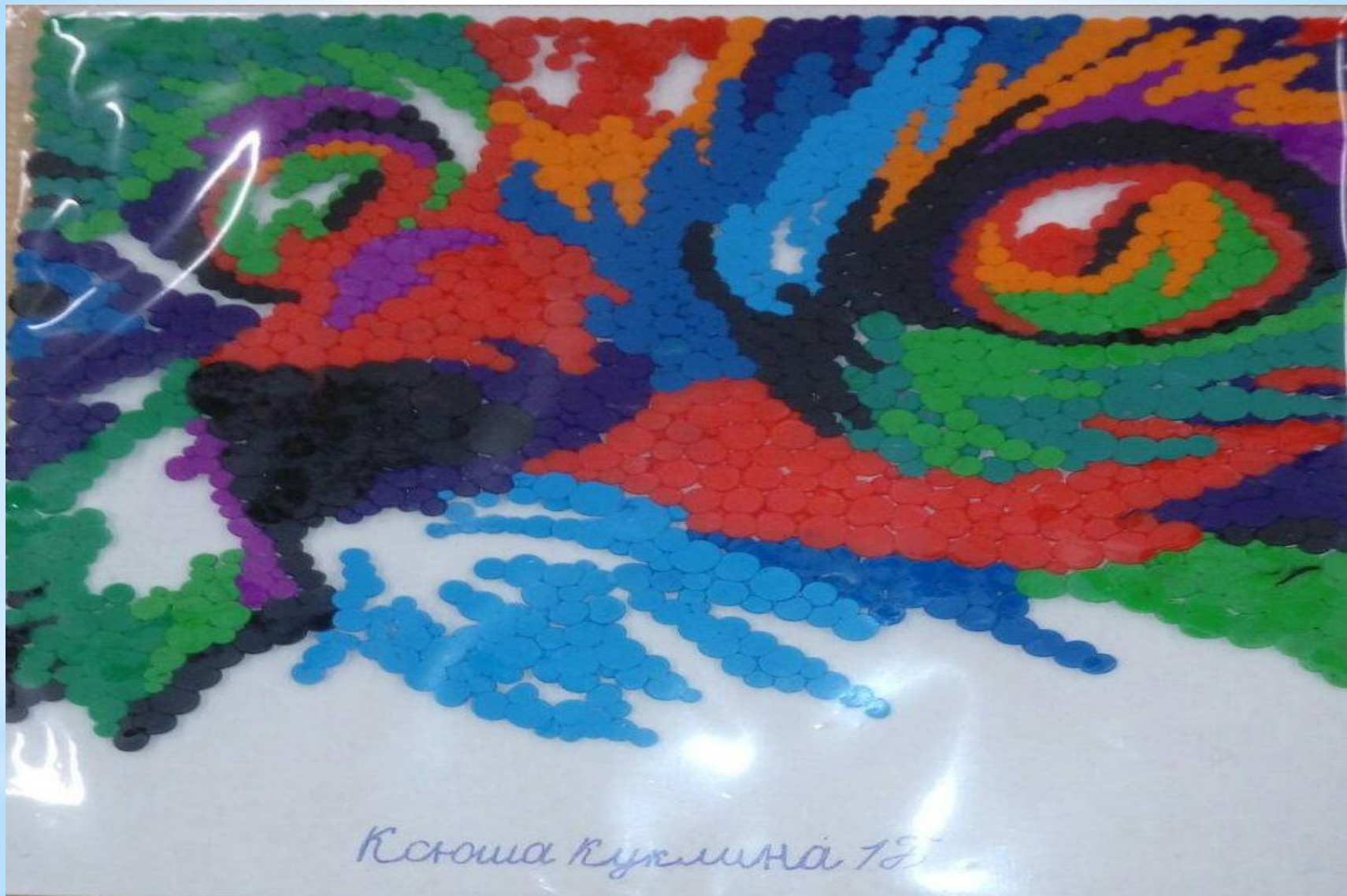
«Задумчивая кошка» - работа Куклиной Ксении 1 Б класс