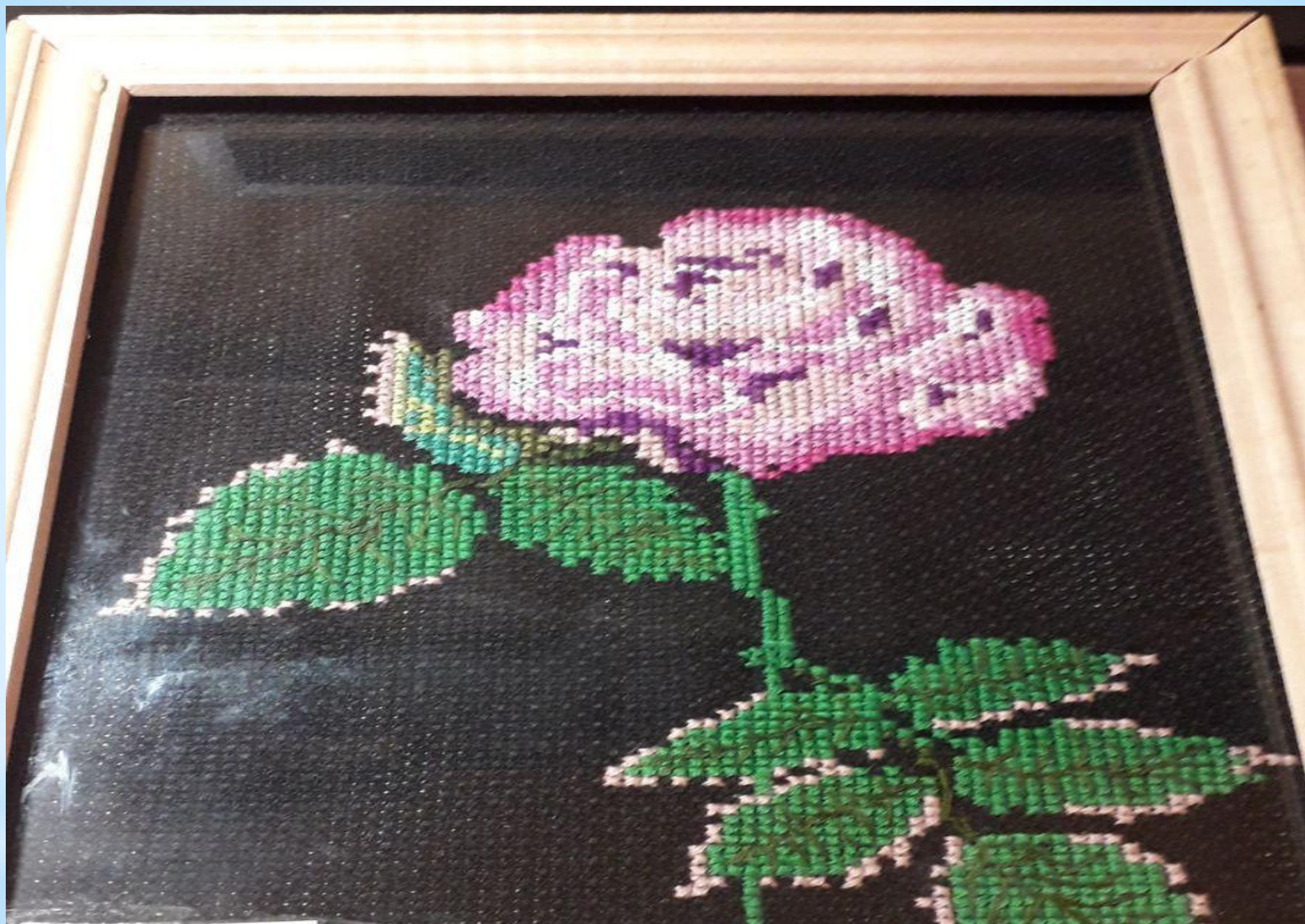
Роза - от Чемякова Егора 1 Б класс