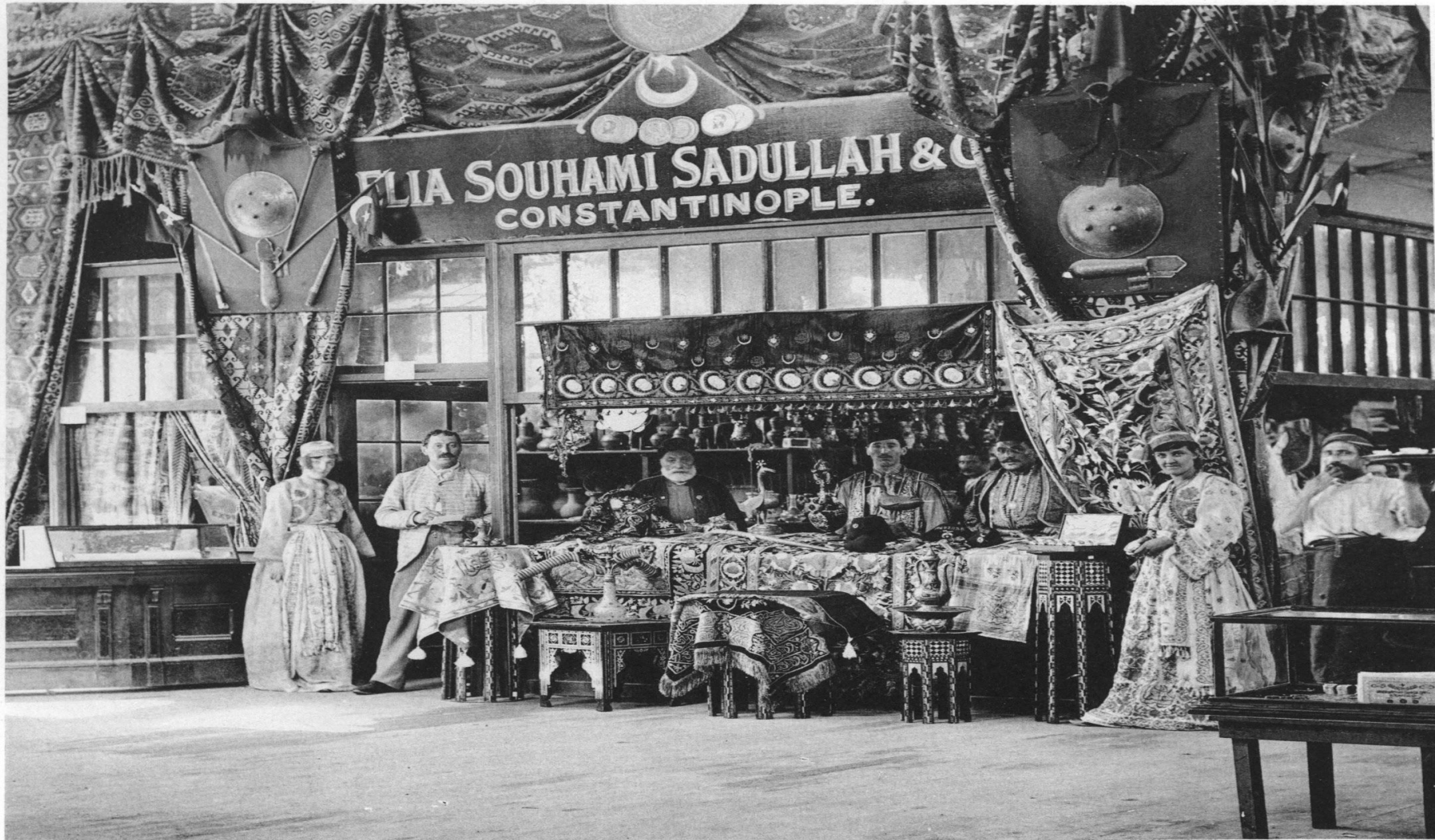
IN THE TURKISH BAZAAR.