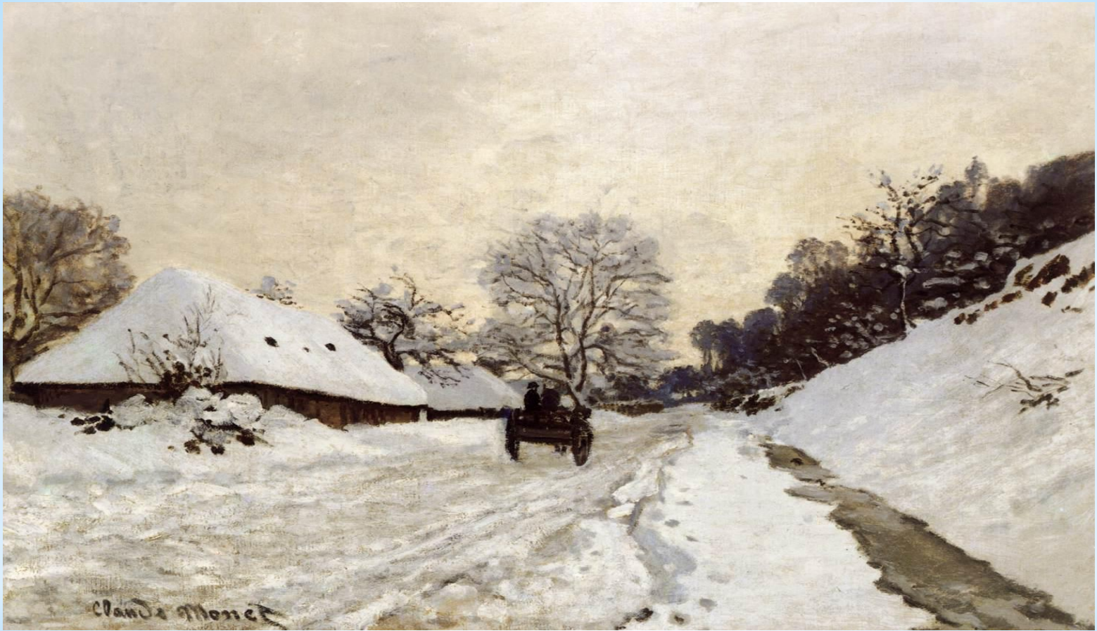
* Клод Моне «Зима»