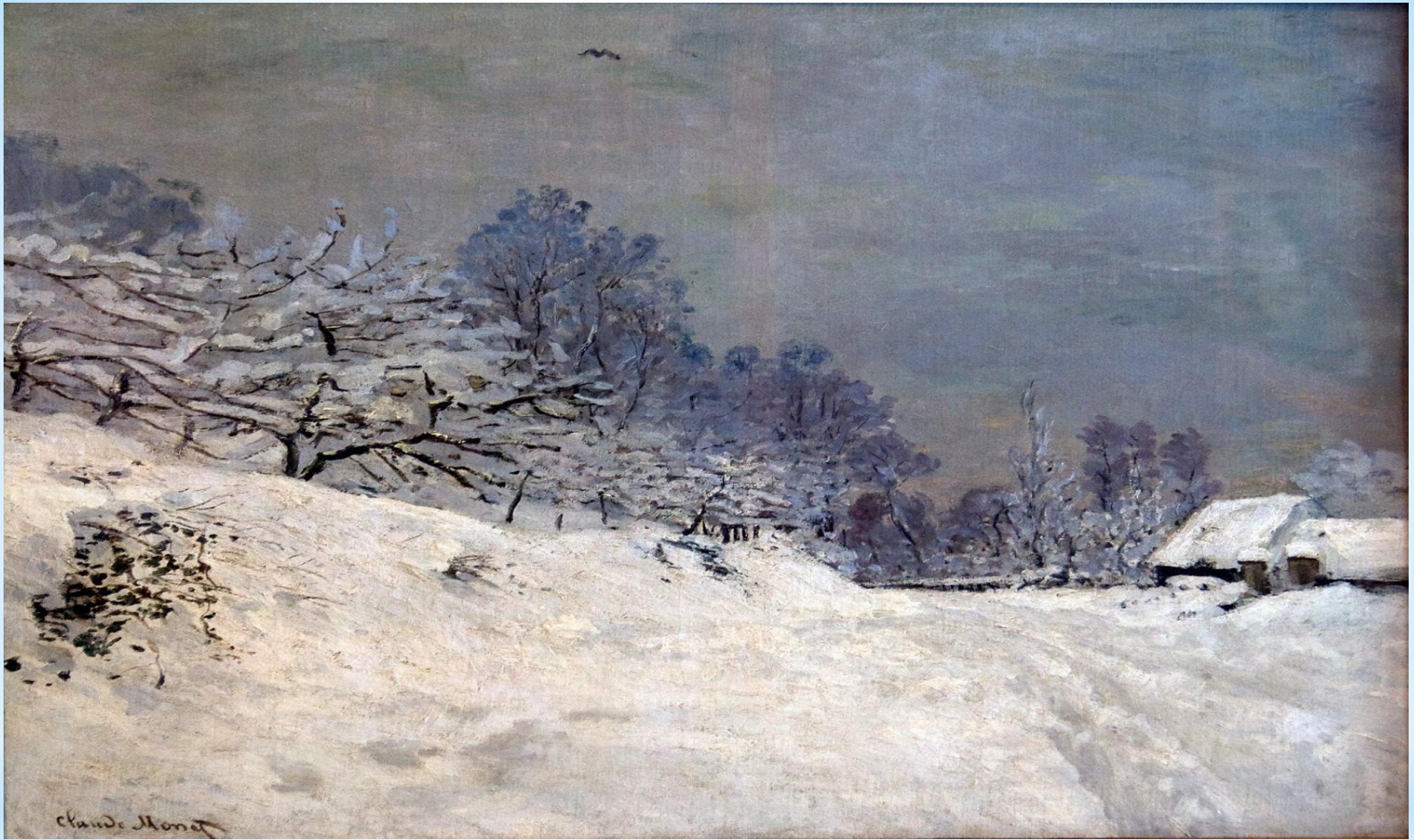
* Клод Моне «Зима»