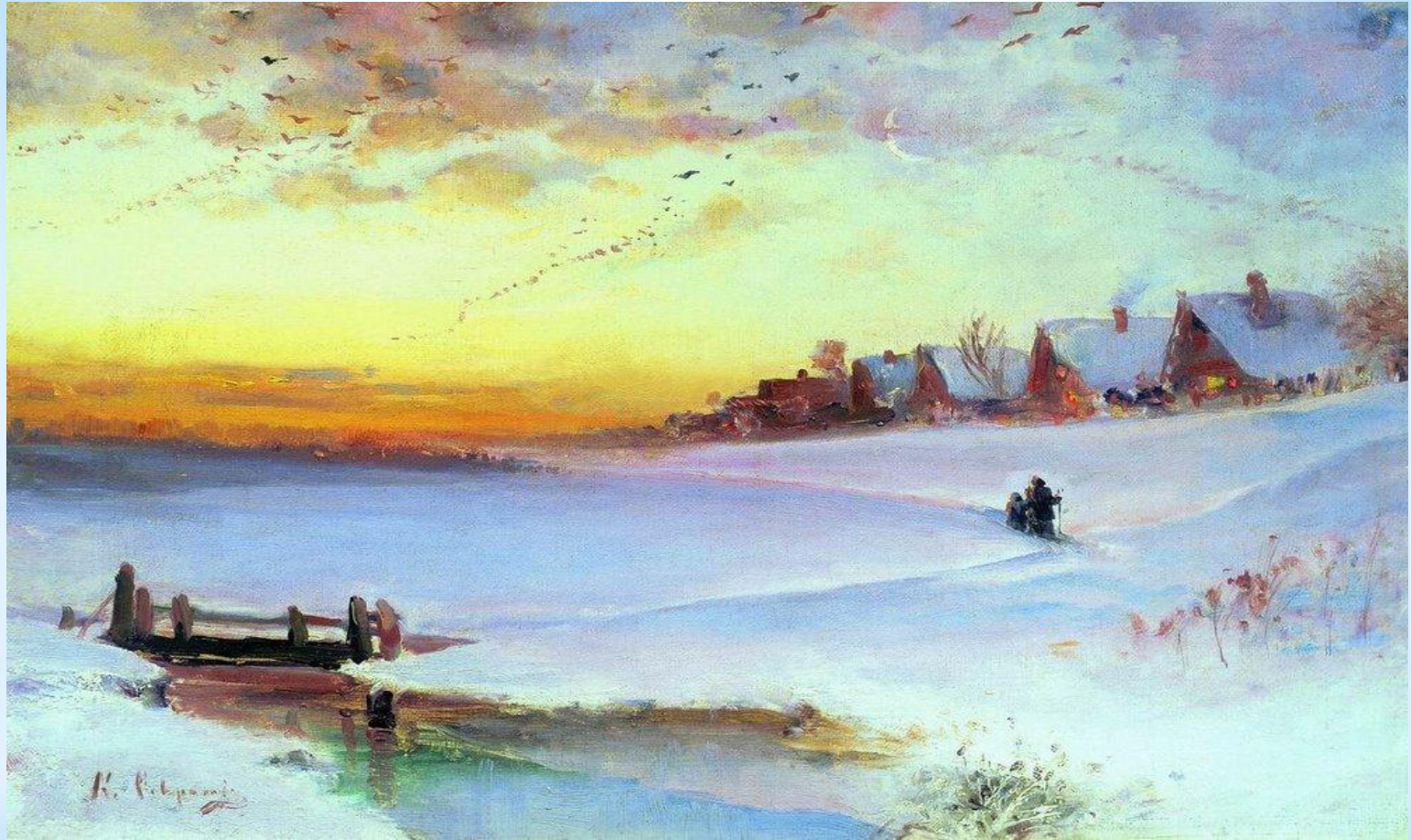
* Алексей Саврасов «Зимний пейзаж»