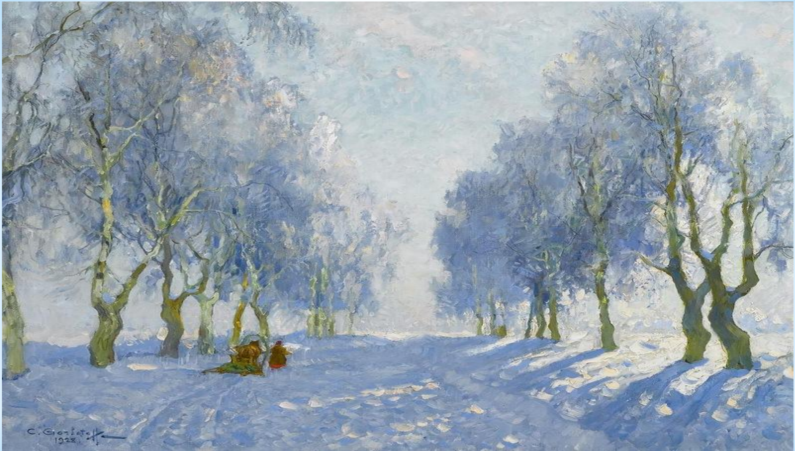
* Алексей Саврасов «Зима»